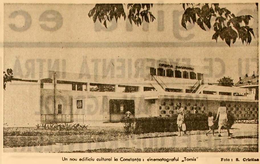
Un nou edificiu cultural la Constanța: cinematograful „Tomis”

Marți s-au încheiat lucrările simpozionului internațional privind limba și literatura română, organizat în stațiunea maritimă Neptun de Comitetul de Stat pentru Cultură și Artă, în colaborare cu Uniunea Scriitorilor și Centrala cărții. Reunind personalități de seamă ale vieții noastre literare și traducători din 14 țări ai operelor unor scriitori români, simpozionul a programat expunerii și comunicării referitoare la problema ale dezvoltării literaturii române, aspecte și tendințe ale prozei, poeziei și dramaturgiei, ale lexicului și analizei stilistice a textelor, precum și discuții cu traducători de literatură română. Propunind și stabilirea de noi contacte între oamenii de literatură și cei de peste hotare, care și consacra activitatea rîspîndirii în lume a valorilor literaturii românești, simpozionul a contribuit la o mai bună cunoaștere și rîspîndire în circuitul universal a operelor literaturii noastre. (Agerpres)