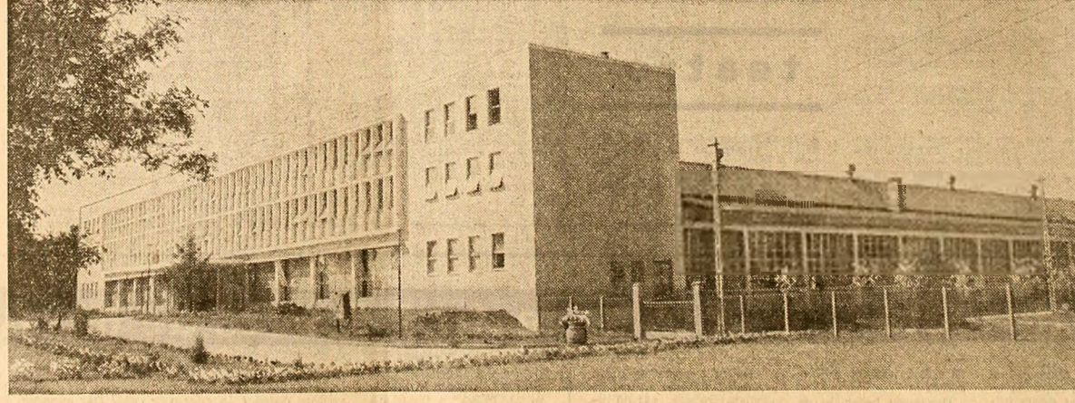
(Urmare din pag. 1)

stituirea nucleelor de autoutilare. Cadrele necesare s-au asigurat prin transferarea celor mai buni ingineri din sectoarele de producţie spre cele de concepţie, întîrînd în acelaşi timp rolul maistrului în conducerea directă a fabricaţiei. În acest fel, concentrarea în serviciile de concepţie a unui număr important de specialiştii face posibil ca autoutilarea să se transforme într-o auzientă muncă de creaţie, care stimulează în permanenţă promovarea susţinută a progresului tehnic, modernizarea producţiei.