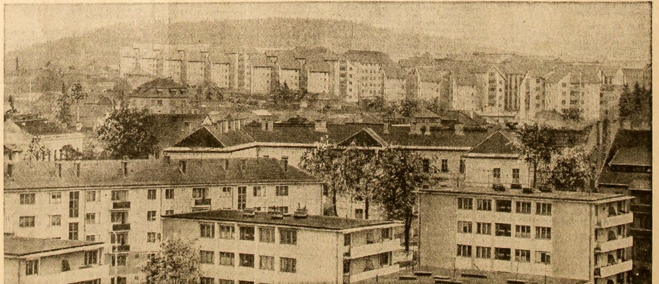
Noua fizionomie urbană a localităților Harghitei: ozi la Miercurea Ciuc