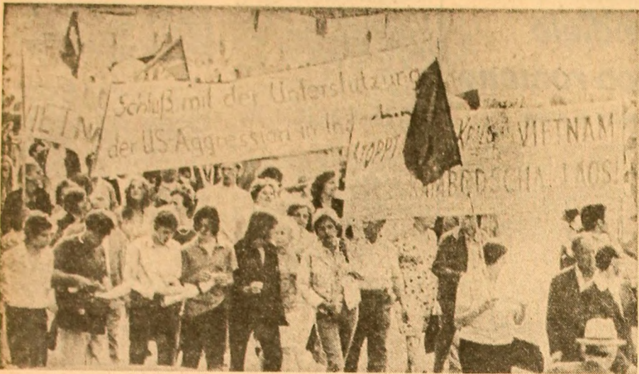
R.F.G. — Mii de locuitori ai orașului Hamburg demonstrând pentru încetarea războiului agresiv dus de Statele Unite în Indochina