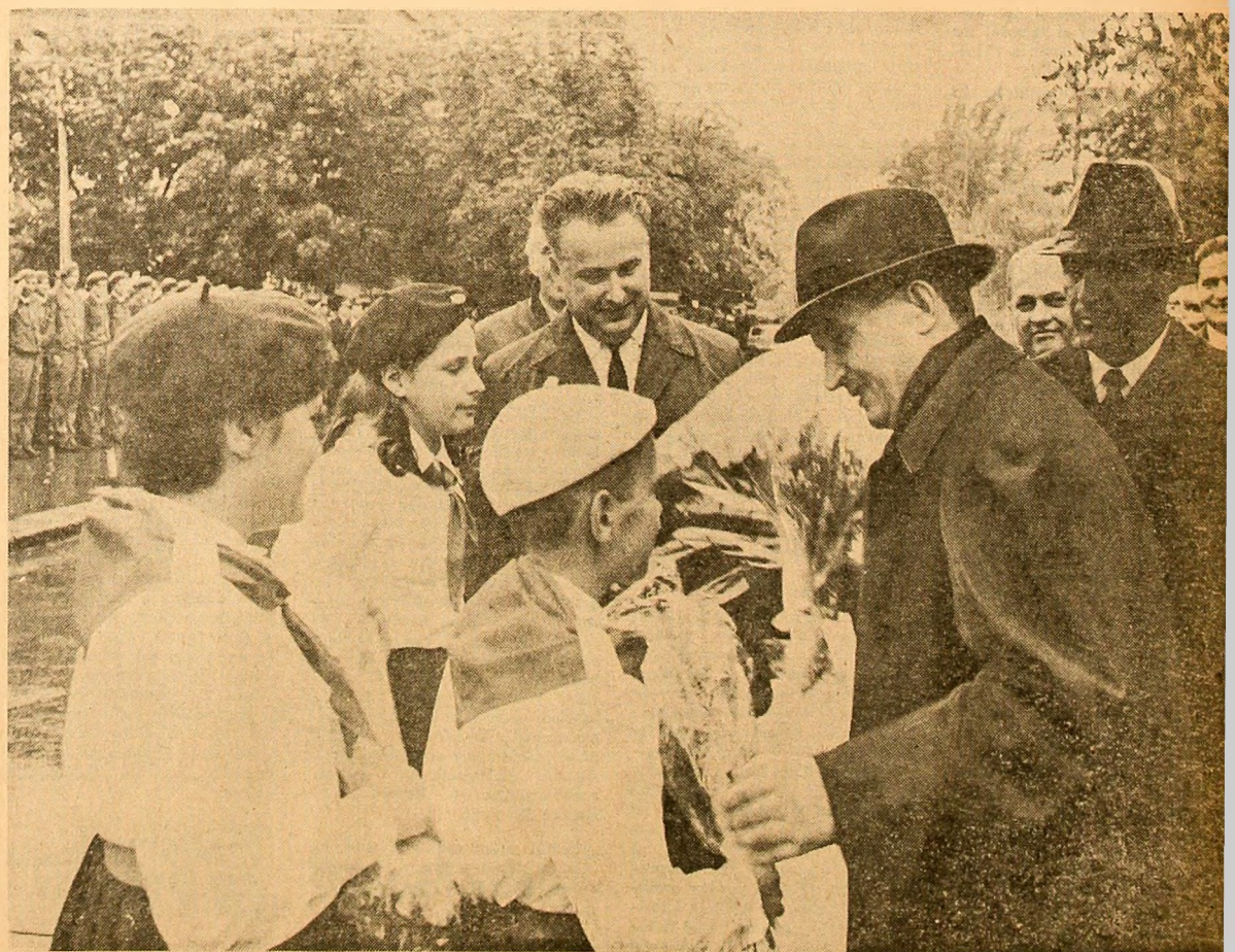
Buchete de flori pentru conducătorul iubit al partidului și statului

Sînt convins că toți comunistii toți oamenii muncii din municipiul Turnu-Severin și din județul Mehedinți vor acționa în acest spirit și doresc să vă urez tuturor succes tot mai mari în întreaga activitate multă sănătate și fericire. (Aplauze puternice, îndelungate; în picioare, asistența ovăționează minute în șir se scandează „Ceausescu-P.C.R.”, „Ceausescu-P.C.R.”. Cei prezenți acclamă puternic pentru Partidul Comunist Român, pentru Comitetul Central, pentru secretarul general al partidului, tovarășul Nicolae Ceausescu.)