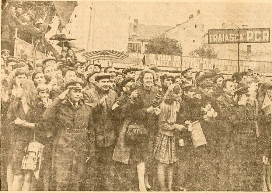
Prelutideni, oamenii muncii înfruptă cu dragoste și bucurie pe conducătorii de partid și de stat, în frunte cu tovarășul Nicolae Ceaușescu

Cu nemărginită dragoste, în numele comunistilor, al tuturor oa-