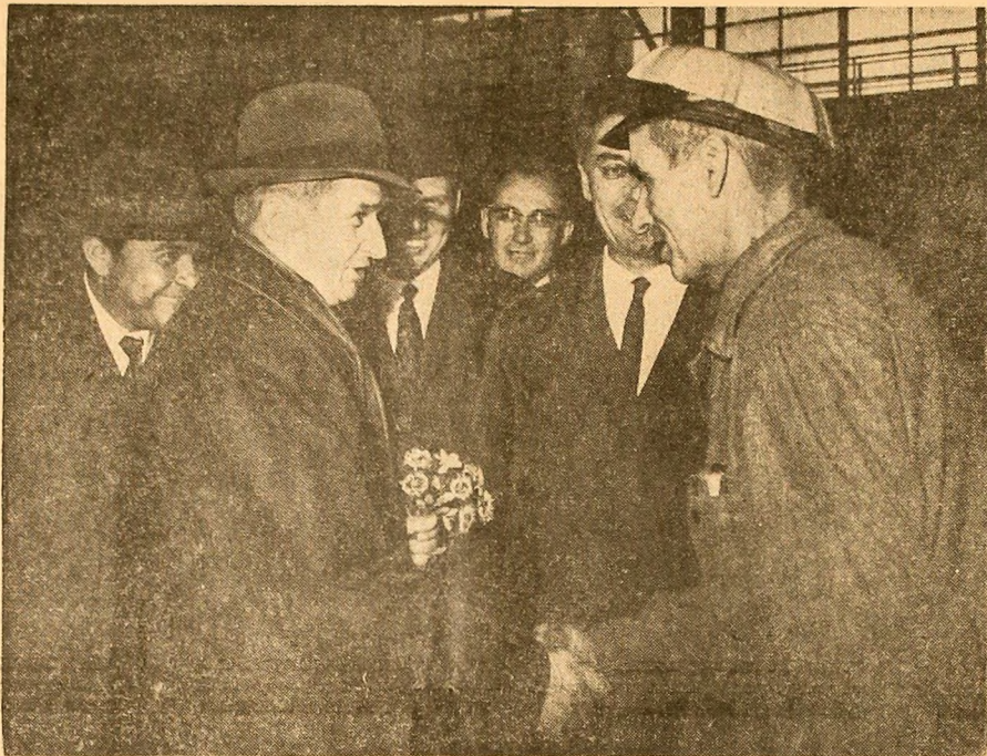
Tovarășul Nicolae Ceaușescu este salutat cu căldură și stimă de constructorii de nave

Și ca de fiecare dată, și ieri indicațiile prețioase date de secretarul general al partidului au constituit un program însușit de muncă, program care a întrunit adeziunea unanimă, toți comunistii, toți oamenii muncii exprinzându-și hotărârea de a lace totul pentru a-l îndeplini.