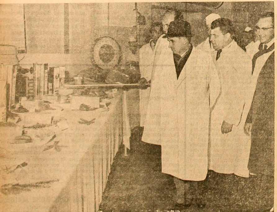
Se vizitează expoziția de produse de la Întreprinderea pentru industrializarea cărnii „Mehedinți”

general al partidului, pe ceilalți conducători de partid și de stat, care se îndreaptă acum spre zona de est a municipiului, spre modernul combinat pentru exploatarea și industrializarea lemnului,