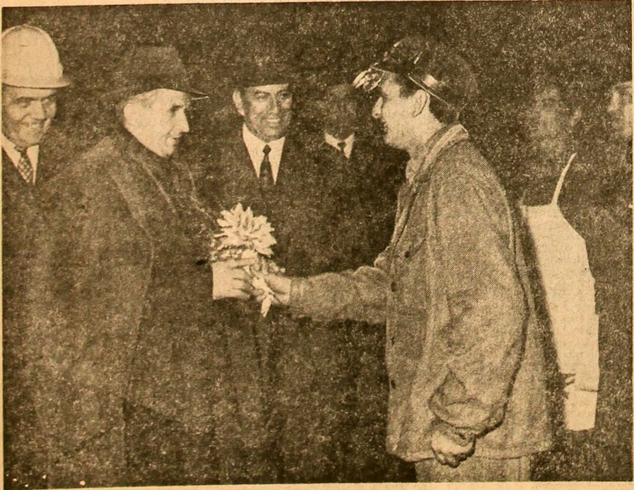
Prețutîndeni, în uzinele vizitate, tovarășul Nicolae Ceaușescu este întîmpinat cu dragoste și stimă de muncitorii