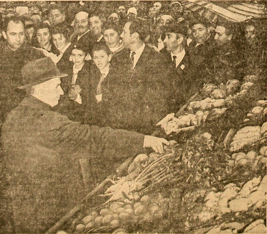
Cooperatorii din Obreja înfățișează roadele muncii lor

După vizita de la uzina „Oțelul Roșu”, conducătorii de partid și de stat se întorc la Caransebeș, unde sînt întâmpinați cu vibrante simțăminte de dragoste.