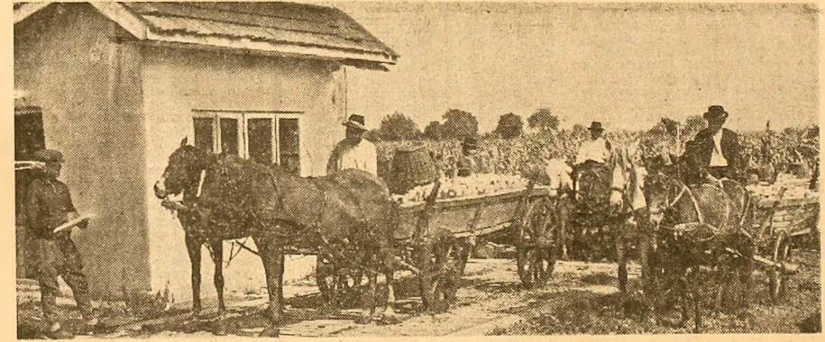
La cooperativa agricolă Brăneşti, judeţul Ilfov, porumbul recoltat din cîmp este cîntărit cu grijă în păţule sau transportat la baza de recepţie

de produse agricole sau la însămînţări. În vederea executării în cele mai bune condiţii a însămînţărilor de toamnă s-a definitivat planul de amplasare a culturilor, iar terenurile care vor fi însămînţate se vor elibera pînă cel mai tîrziu la 1 octombrie. De asemenea, pînă la aceeaşi dată vor fi pregătite pentru însămînţat cel puţin 70 la sută din suprafeţe. Spre deosebire de alţi ani, spunea directorul general al Direcţiei judeţene agricole, în această toamnă cea mai mare parte din grâu va fi însămînţat pe terenuri care au fost cultivate cu plante bune premergătoare. Totodată, suprafeţele pe care se vor însămînţa păioasele vor fi din vreme eliberate şi pregătite. Pînă la 20 septembrie s-au executat arături pe o suprafaţă de 41 500 hectare, iar 37 190 hectare, adică jumătate din suprafaţa care se va însămînţa cu grâu, a fost pregătită. Aurel POP correspondentul „Scintilei”