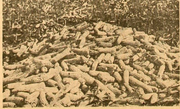
Cooperatorii din Lehliu, judeţul Ialomiţa, au amplasat o importantă suprafaţă cu grâu după porumb. Aceasta i-a determinat să treacă de urgenţă la recoltatul porumbului şi eliberarea terenului pentru a se putea ara şi semăna (fotografia din stînga). Grămezi de porumb cit vezi cu ochii, care stau sub cerul liber ÎNCA ÎNAINTE DE VENIREA PLOIILOR, fără ca cineva să se intereseze de soarta lor. De altfel, porumbul a început chiar să muşcească. Regretăm că o asemenea imagine (fotografia din dreapta), am întîlnit-o chiar pe terenurile Institutului de cercetări pentru cereale şi plante tehnice Fundulea.