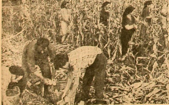
Cooperatorii din Lehliu, judeţul Ialomiţa, au amplasat o importantă suprafaţă cu grâu după porumb. Aceasta i-a determinat să treacă de urgenţă la recoltatul porumbului şi eliberarea terenului pentru a se putea ara şi semăna (fotografia din stînga). Grămezi de porumb cit vezi cu ochii, care stau sub cerul liber ÎNCA ÎNAINTE DE VENIREA PLOIILOR, fără ca cineva să se intereseze de soarta lor. De altfel, porumbul a început chiar să muşcească. Regretăm că o asemenea imagine (fotografia din dreapta), am întîlnit-o chiar pe terenurile Institutului de cercetări pentru cereale şi plante tehnice Fundulea.

şăminte chimice circa 20 000 hectare. Însămînţările vor începe de la o zi la alta, imediat după ce se va zvînta terenul şi va putea suporta maşinile agricole. S-au dat noi indicaţii de a se face proba semănturilor la capetele de tarle în scopul realizării unei densităţi corespunzătoare la cultura grîului. În ce priveşte recoltatul porumbului şi celorlalte culturi de toamnă, în fiecare unitate agricolă au fost alcătuite grafice la executarea lucrărilor, în funcţie de urgenţa eliberării suprafeţelor respective şi a forţei de muncă existente.