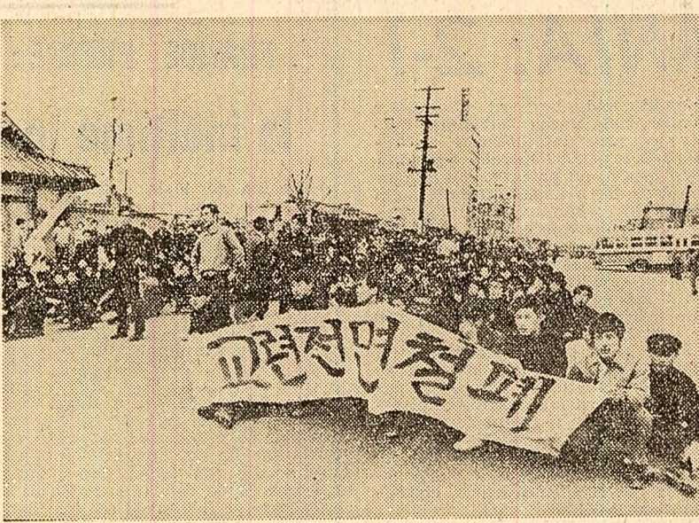
Seul. Imagine de la recente demonstrații studențești antiguvernamentale. Studenții au cerut abolirea instrucției militare obligatorii, refuzînd să fie corne de tun pentru regimul antipopular din Coreea de sud

R.P.D. Coreeană și Insulele Mauricius au hotărât să stabilească relații consulare, anunță din Port Luis agenția A.C.T.C.