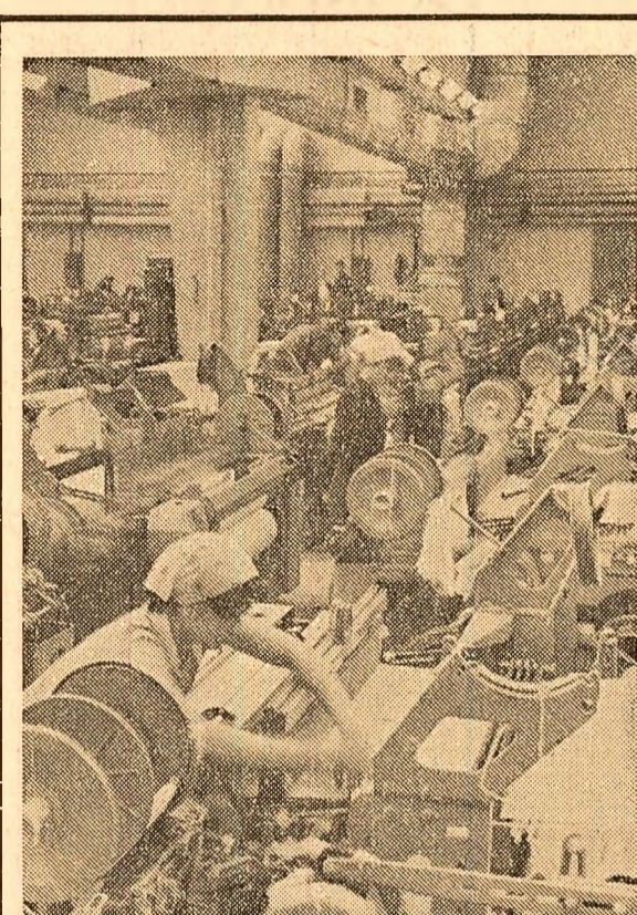
LA UZINELE TEXTILE „MOLDOVA” — BOTOȘANI

BARTUNEK István correspondentul „Scînteii”