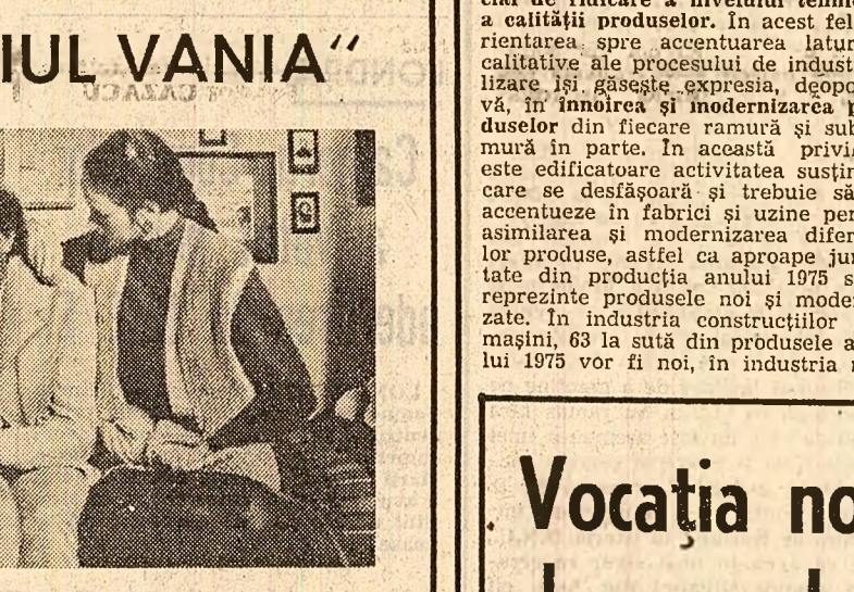
Scenariul și regia: Andrei Koncalovski, după piesa lui A. P. Cehov. Cu: Innokenti Smoktunovskii, Serghei Bondarciuk, Vladimir Zeldin, Irina Kupcenko, Irina Miroslavnenko, Irina Anisimova-Vull.