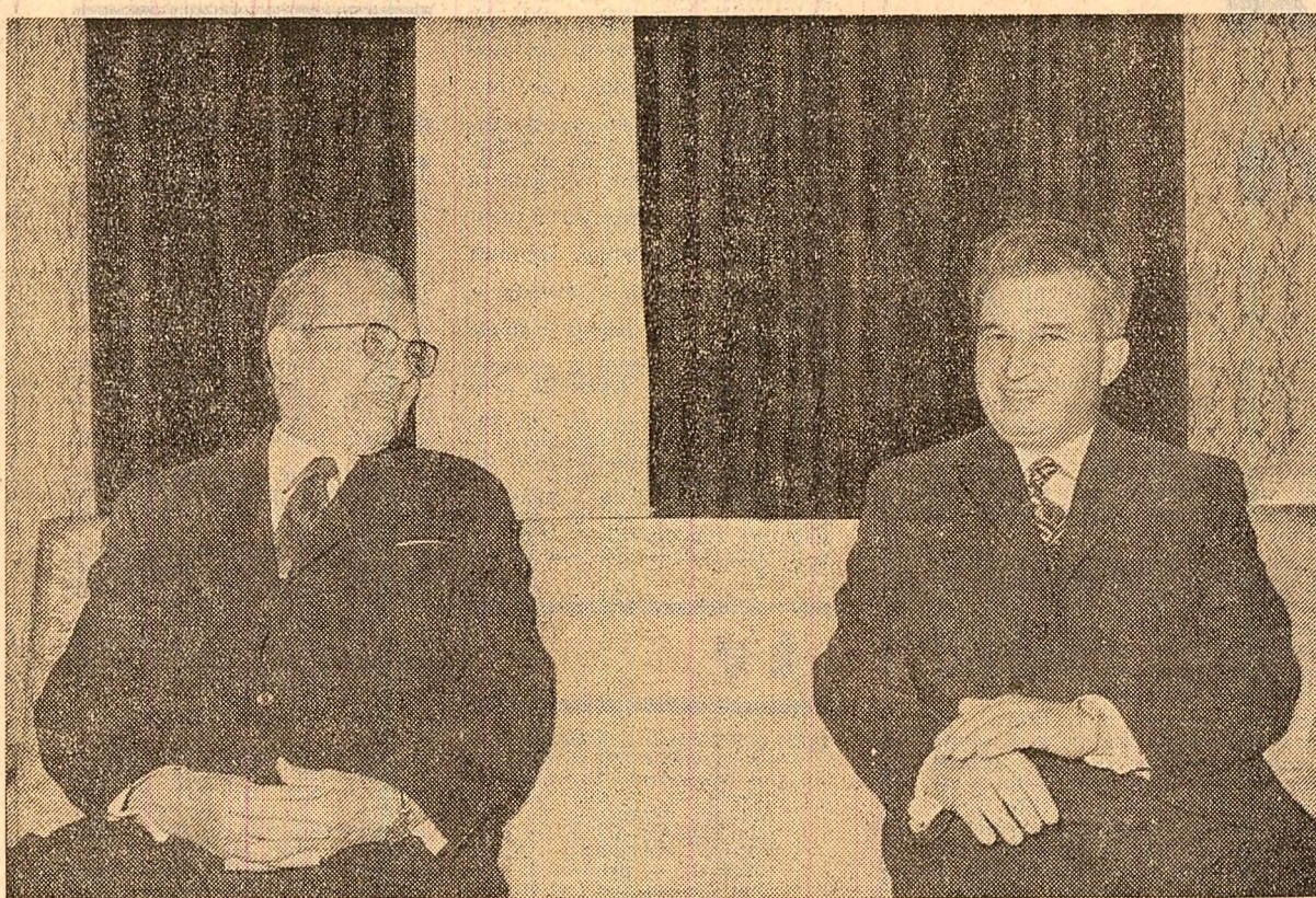
In timpul convorbirilor dintre președintele Nicolae Ceaușescu și președintele Iosip Broz Tito