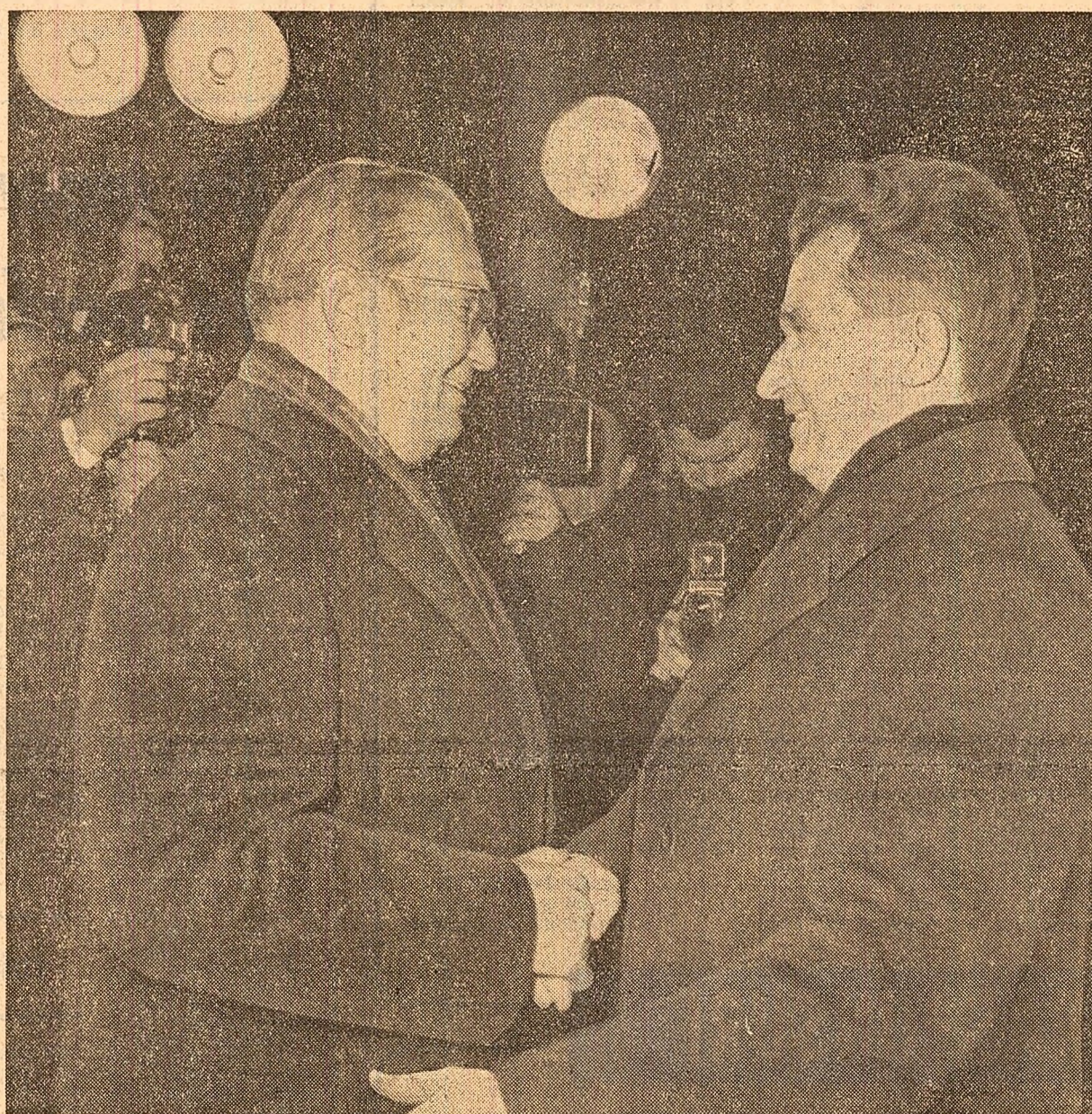
La sosire, în gara Timișoara