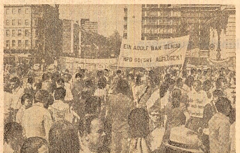
La Frankfurt pe Main (R.F.G.) a avut loc o puternică demonstrație pentru interzicerea partidului intitulat „național-democrat”, partid de extremă dreapta, neonazist