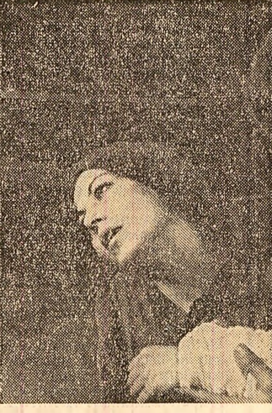
Scenă din spectacolul „Ecaterina Teodoroiu” în interpretarea colectivului Teatrului Municipal „Maria Filotti” din Brăila