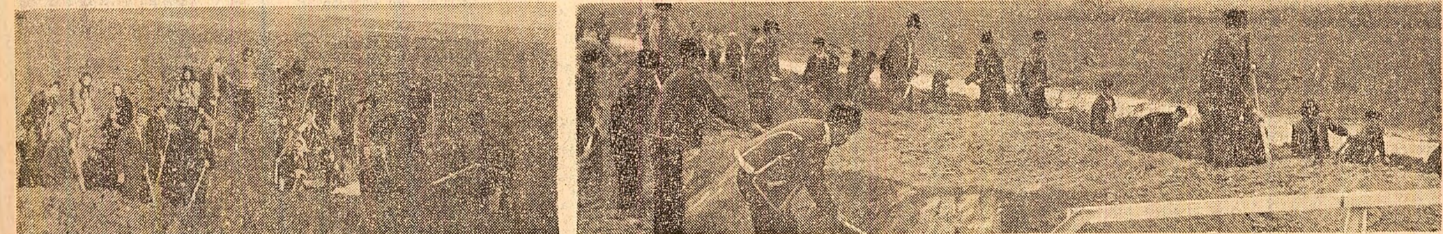
La Buzești, județul Argeș, fiecare locuitor participă la deschiderea canalelor, pentru evacuarea excesului de apă de pe toate pămînturile comunei. (Fotografia din stînga). Sute de cooperatori de la C.A.P. Golovanu, județul Vrancea, ridică un nou dig împotriva apelor (fotografia din dreapta)