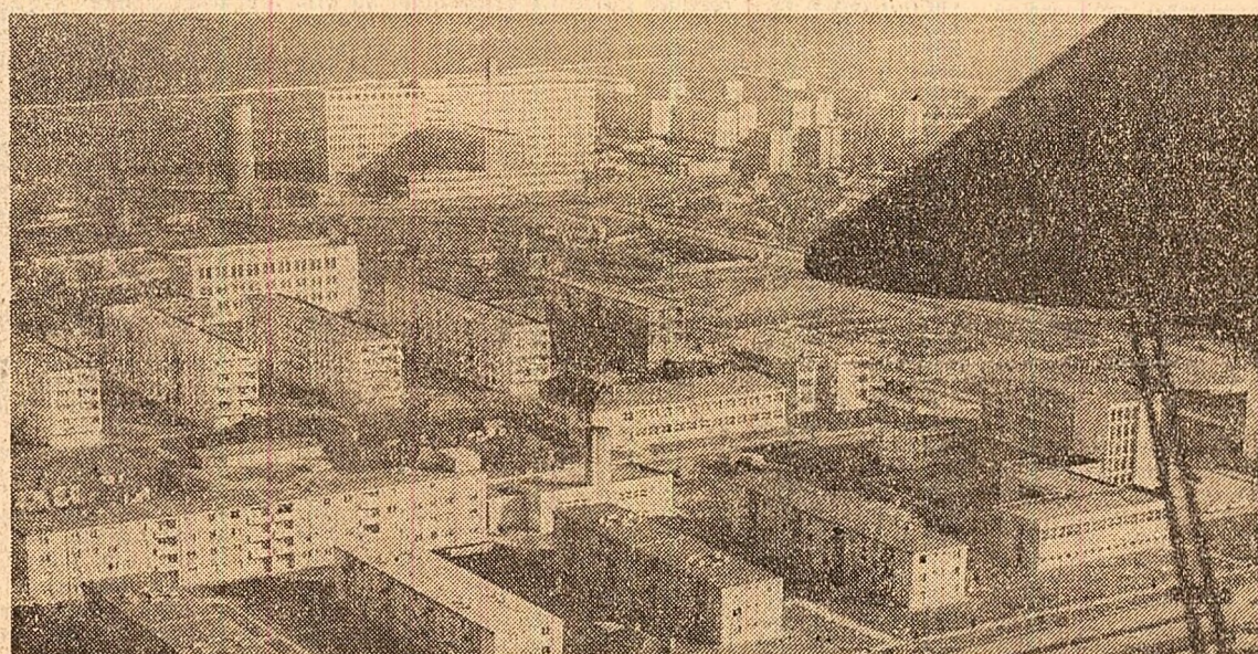
Slobozia — loc unde prefaceri de esență acreditează o nouă imagine, demolind-o din conștiințe pe cea veche