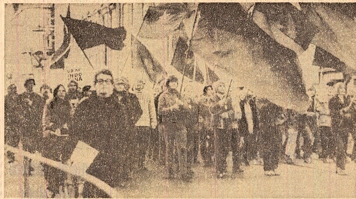
Danemarca. Purțind steaguri ale Guvernului Revoluționar Provizoriu, la Copenhaga a avut loc un marș pentru încetarea agresiunii S.U.A. în Vietnam

europene, René Maheu a relevat că misiunea pasnică încredințată acestei organizații în momentul creării ei o obligă să sprijine orice inițiativă în privința colaborării dintre țările europene: „de aceea — a spus el — consider oportunitate să atrag atenția statelor membre ale UNESCO că organizația noastră și-ar putea aduce contribuția la pregătirea conferinței general-europene”.