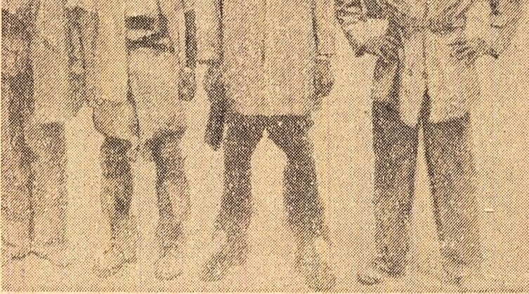
Un grup din cei 13.000 de muncitori și funcționari greviști din Namibia (Africa de sud-vest) care s-au ridicat la luptă împotriva condițiilor inumane de muncă și de viață, împotriva sistemului barbar al apartheidului impus de regimul Republicii Sud-Africane