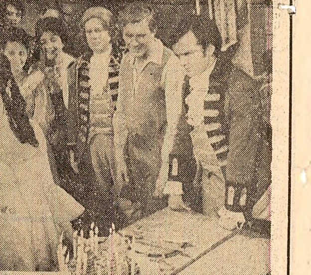
O coproducție Franco London Film-O.R.T.F.-DEROPA cu participarea studioului cinematografic București după romanul lui Fenimore Cooper...