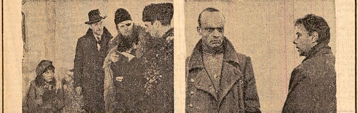
Producție a studioului Mosfilm, panoramic-color. Scenariul și regia: Aleksandr Alov și Vladimir Naumov, după operele lui Mihail Bulgakov.