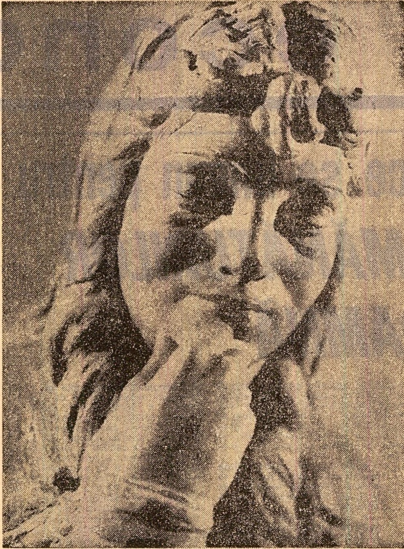
In sala Dalles din Capitala este deschisă o amplă retrospectivă a sculptorului Romul Ladaea.

Una dintre aceste forme de acțiune este pe larg menționată în capitoul intitulat „Împreună cu comunistii spre insurjecția armată”.