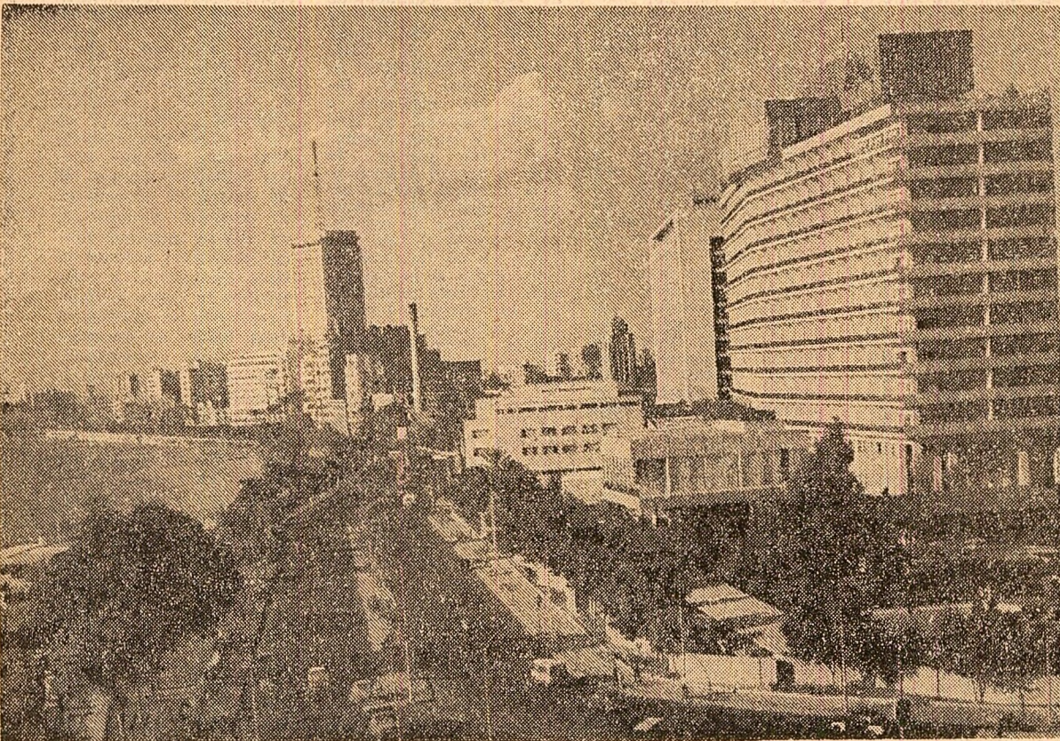
Vedere din centrul orașului Cairo