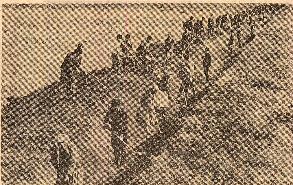
Cooperatorii de la C.A.P. Bocsig, județul Arad, lucrînd la curățirea canalului principal din sistemul de irigații.