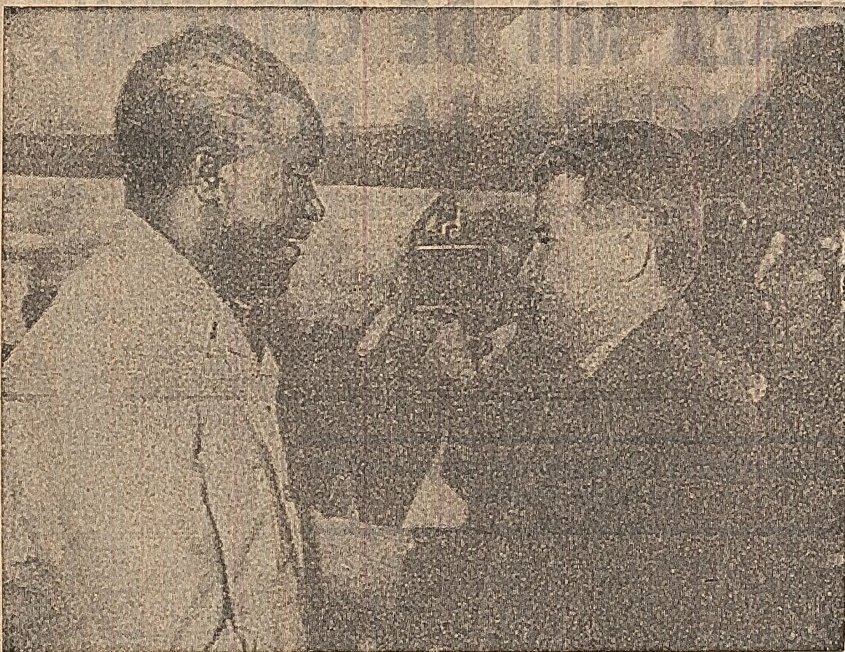
Imagine din ziua de 23 martie: Pe aeroportul din Lusaka, președintele Nicolae Ceaușescu și Kenneth Kaunda își string mâna cu căldură