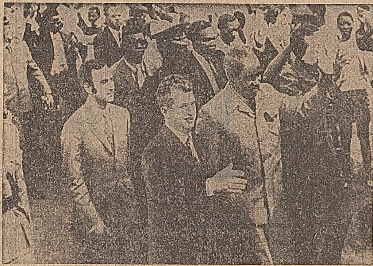
Ca peste tot de-a lungul traseului african, la Lusaka tovarășul Nicolae Ceaușescu este salutat cu deosebită căldură de populație

al prieteniei calde, al stimei și prețuirii reciproce