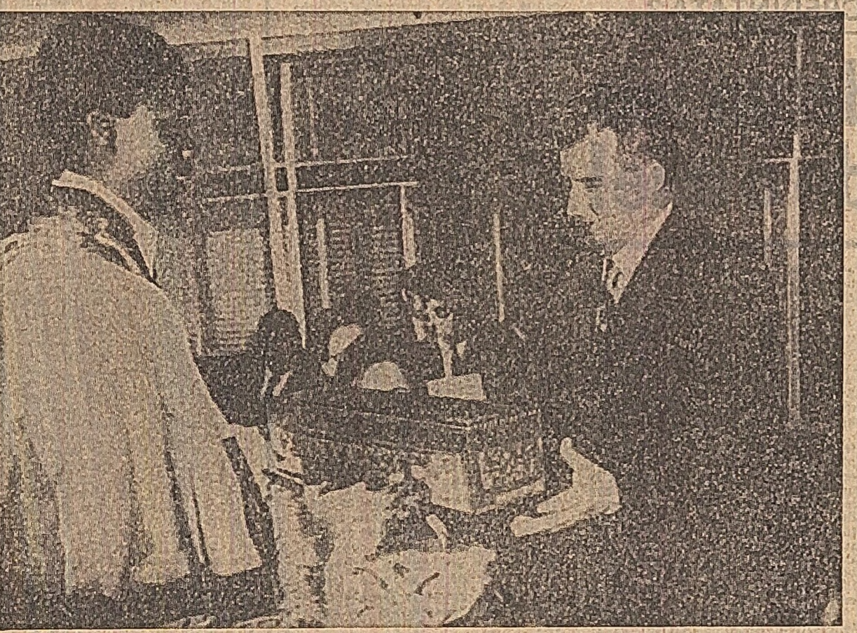
Președintele în Zambia, primire prietenească, manifestări de cordialitate

● Au continuat convorbirile oficiale între președinții Nicolae Ceaușescu și Kenneth Kaunda