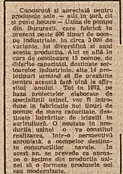
Cunoscută și apreciată pentru produsele sale — atât în țară, cât și pe piețele externe — Uzina de pompe din București, care fabrică în prezent peste 600 tipuri de pompe industriale, în circa 3.000 de variante. Isti diversitate și anii acesteia producție. Aici se află în curs de finalizare și pompa de diferite capacități, destinată sectorului industrial. Aste 14 prototipuri urmind să fie prezentate pentru această fază pînă la sfîrșitul anului.

Spunem aceasta deoarece chiar și în unele județe din înălțimea de sud a țării există suprafețele care nu s-au fost însămînțate încă. Nu numai la porumb, ci și la celelalte culturi trebuie să se realizeze întregul suprafețele prevăzute a se cultiva. Or, acum, cînd ne aflăm în luna aprilie, este foarte important să se realizeze în cele mai bune condiții însămînțarea și executarea lucrărilor de întreținere a culturilor.