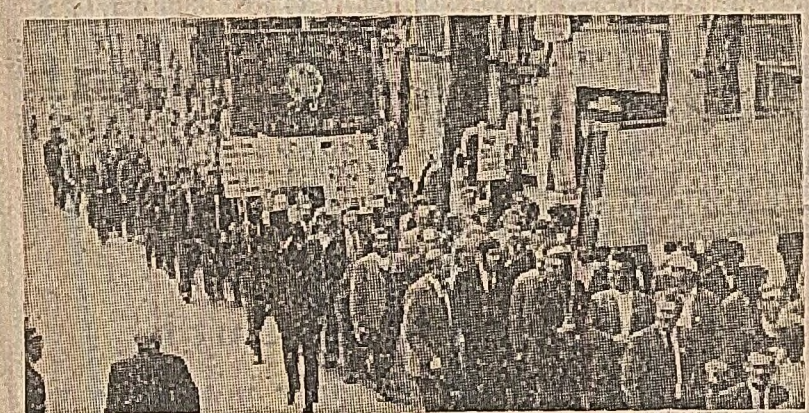
Londra. Demonstrația a muncitorilor constructori în sprijinul revendicărilor lor economice

clarare în care se arată că, în zilele de 17 și 18 mai, o dată cu mișcarea și blocarea porturilor R. D. Vietnam și bombardarea orașului Hanoi și a portului Haiphong, forțele S.U.A. au efectuat raiduri de bombardament asupra unor zone populate din provinciile Vinh Phu, Ha Bac, Quang Ninh, Nam Ha, Ninh Binh, Thanh Hoa, Nhai An și Quang Binh, precum și din zona Vinh Linh. În același timp, navele de război americane au atacat cu artileria zonele populate de pe litoralul provinciei Thai Binh, Nam Ha și Thanh Hoa. Ca urmare a acestor noi acte agresive, au fost înregistrate numeroase victime omenești și au fost provocate grave daune materiale, unor obiective economice, culturale și sociale din R. D. Vietnam. Forțele armate și populația din zonele amenințate au dat înmănușul rezistență curajată, dobândind 12 avioane. Noul act de încălcare a suveranității și securității R. D. Vietnam este condamnat cu violență de către M.A.E. al R. D. Vietnam. În încheierea zonei este încheiată imediat minime, a bombardamentelor și a tuturor acțiunilor împotriva R. D. Vietnam.