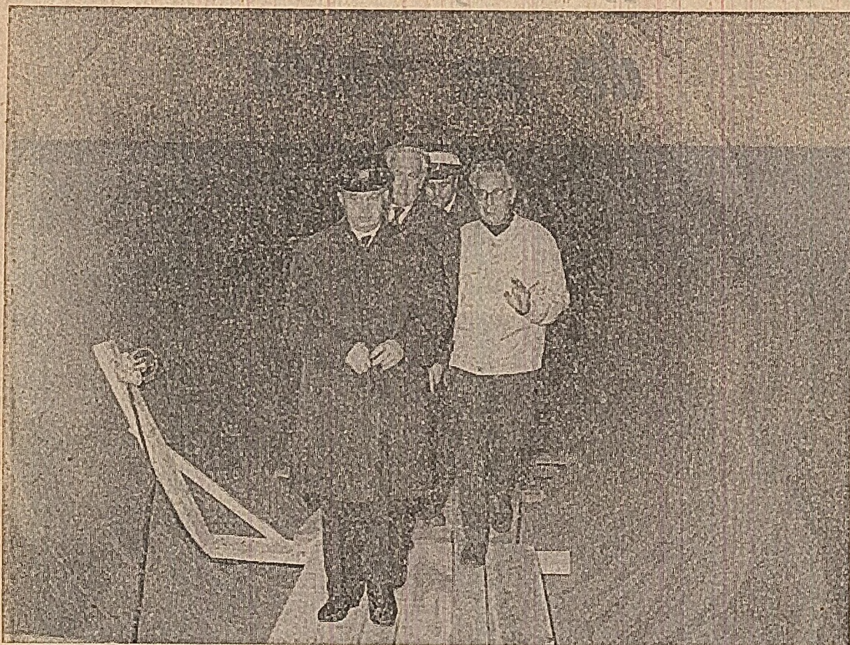
Sîrbăind galeriile subterane ale celei mai mari hidrocentrale de pe apele interioare ale ţării.