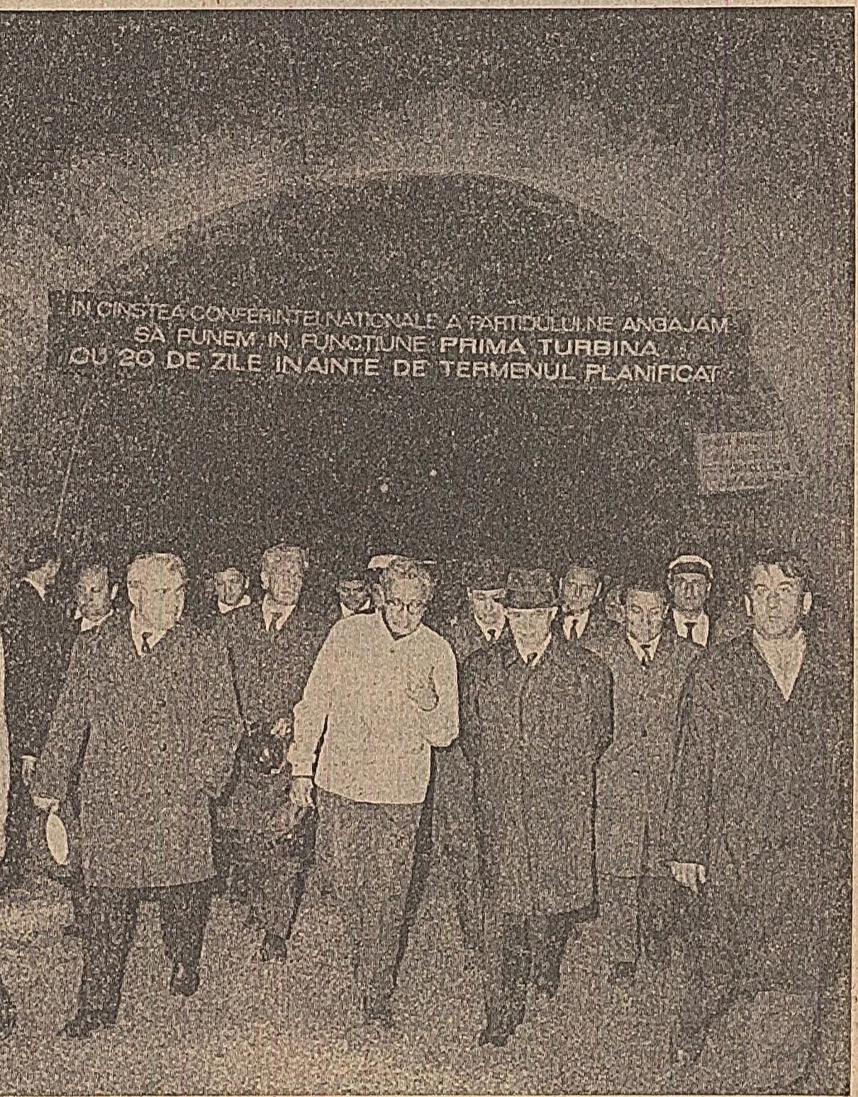
ÎN CINȘTEA CONFERINȚEI NAȚIONALE A PARTIDULUI NE ANGAJĂM SĂ PUNEM ÎN FUNCȚIUNE PRIMA TURBINA CU 20 DE ZILE ÎNAINTE DE TERMENUL PLANIFICAT

Cel peste 7.000 de constructori ai marii hidrocentrale de la Lotru au trăit ieri momente de adevărată sărbătoare, prilejului de prezența în mijlocul lor a tovarășului Nicolae Ceaușescu, secretar general al partidului.