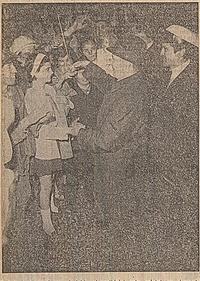
Pretutindeni, conducătorul iubit al partidului este salutată cu dragoste şi simă.

În aceste zile de puternică atmosferă politică generată de apropiata Conferinţă Naţională a Partidului Comunist Român şi de aniversare a 25 de ani de la proclamarea Republicii, oamenii muncii din unităţile economice îşi exprimă hotărîrea fermă de a împlini cele două evenimente de însemnătate istorică din viaţa partidului şi poporului nostru cu noi succese în producţie. • Muncitorii, inginerii şi tehnicienii fabricii de oţel „Argeşana” din Piteşti s-au angajat să realizeze, peste prevederile planului, o producţie marfă în valoare de 50 milioane lei materializată între altele, în 50 tone fire tip lînă, 23 000 mc oţel şi să obţină beneficii suplimentare însumînd 5 milioane lei. • Constructorii de pe şantierul noul secţii de finisaj a întreprinderii „Textila” din această localitate au executat pînă acum peste 18 la sută din volumul lucrărilor de construcţie şi 70 la sută din cel de montaj. fapt ce va permite realizarea angajamentului luat de a deversana cu două luni termenul de punere în funcţiune a acestui obiectiv. Întreprinderea va dispune astfel, în cursul de o perioadă secţie de finisaj, cu o capacitate anuală de două ori mai mare decît a celei existente. • Colectivul întreprinderii miniere din Clujputniş-Muşcel s-a angajat ca printr-o mai bună organizare a muncii în subteran să realizeze suplimentar 10 000 tone de cărbune, să se obţină o creştere cu 616 lei a productivităţii muncii pe salariat.