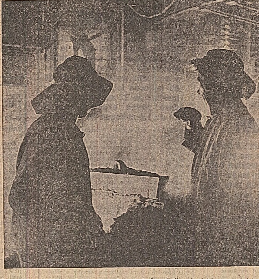
În aceste zile de pulemică întrecere în muncă, fărîșii rezistenți își consacra întregă energie și pricepere pentru folosirea cu mai deplină a agregatelor, pentru ridicarea calității producției