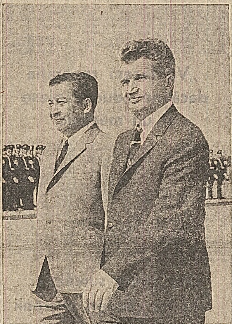
Ceaușescu își strîng călduros mîinile, se îmbrățează. Tovarășii Elena Ceaușescu și prințesa Monique Sianuk își dau rămas bun cu cordialitate. Un grup de pionieri oferă oaspeților buchete de flori.

La despărțire, prințul Norodom Sianuk și președintele Nicolae