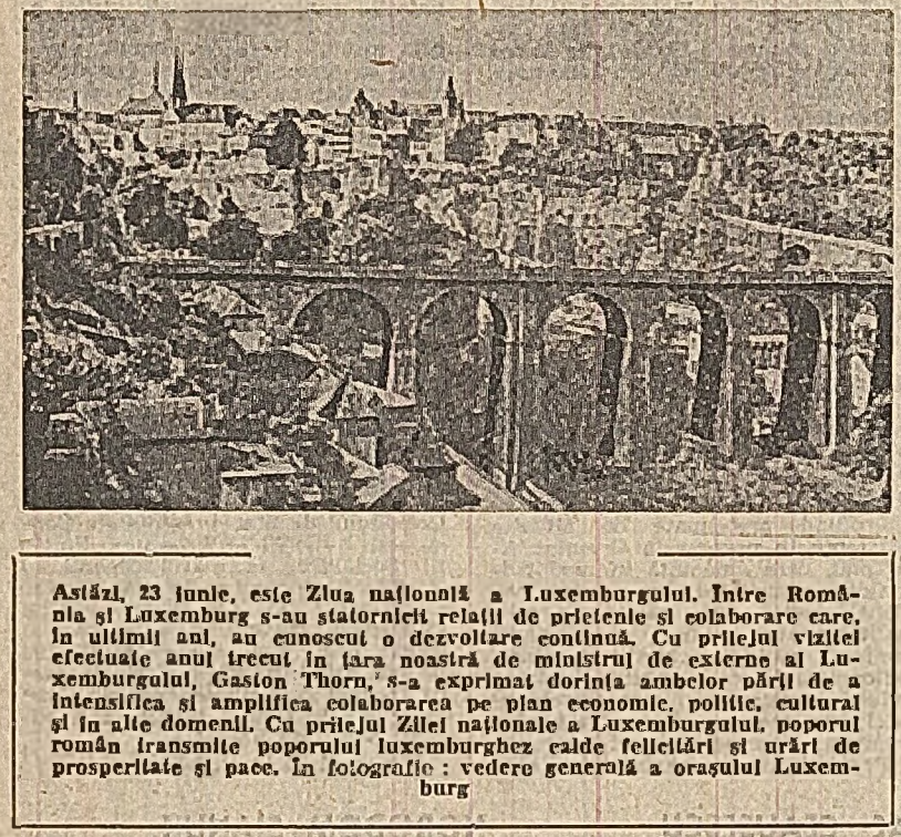
Aziăzi, 23 iunie, este Ziua națională a Luxemburgului. Intre România și Luxemburg s-a stabilit relații de prietenie și colaborare care, în ultimii ani, au dus la dezvoltarea continuă. Cu prilejul vizitei efectuate anul trecut în țara noastră de miniștrii de externe ai Luxemburgului, Gaston Thorn, s-a exprimat dorința ambelor părți de a intensifica și amplifica colaborarea pe plan economic, politic, cultural și în alte domenii. Cu prilejul zilei naționale a Luxemburgului, poporul român transmite poporului luxemburghez calde felicitări și urări de prosperitate și pace. În fotografia de vedere generală a orașului Luxembourg.

— Beni, Bolivia, Chile, Columbia și Ecuador — și-a încheiat lucrările la Lima. Cel mai înalt nivel de externe subliniază, într-o declarație publicată cu acest prilej, progresul înregistrat în largirea cooperării economice dintre țările lor și reafirmă voința statelor semnatare ale acordului de la Cartagena de a acționa în continuare pentru aprofundarea și consolidarea acesteia.