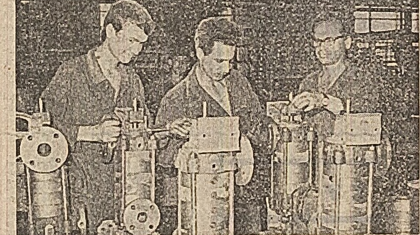
de însemnă încă 8-9 reperce realizate într-un schimb. Un alt utilaj, masina agregat de prelucrat carcase, construită tot prin