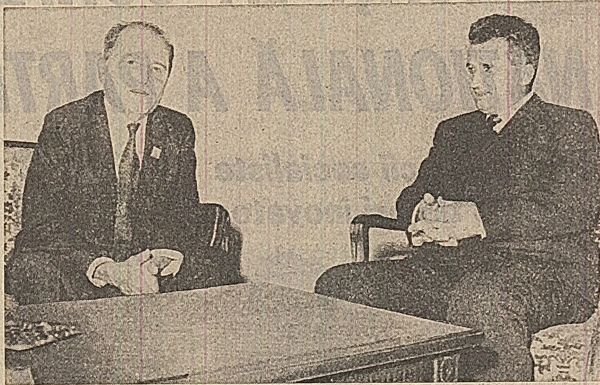
Joi după-amiază, tovarășul Nicolae Ceaușescu, secretar general al Partidului Comunist Român, s-a întâlnit cu tovarășul Luis Carlos Prestes, secretar general al Partidului Comunist Brazilian, care, la invitația C.C. al P.C.R., face o vizită de prietenie în Republica Socialistă România. La primire au participat tovarășii Gheorghe Pană, membru al Comitetului Executiv, al Prezidiului Permanent, secretar al C.C. al P.C.R., Ștefan Andrei, secretar al

• SCRISORI CĂTRE REDACȚIE • FAPTUL DIVERS • SE EXTINDE REȚEAUA LICEELOR DE SPECIALITATE • CONCERTELE ABSOLVENȚILOR • NOTE DE LECTURĂ • FESTIVALUL HUNEDOREAN „SARMIS” • SPORT • ȘTIRI EXTERNE • LA RELUAREA LUCRĂRILOR COMITETULUI DE LA GENEVA — IMPERATIVUL: MĂSURI CONCRETE ÎN PROBLEMELE ESENȚIALE ALE DEZARMĂRII