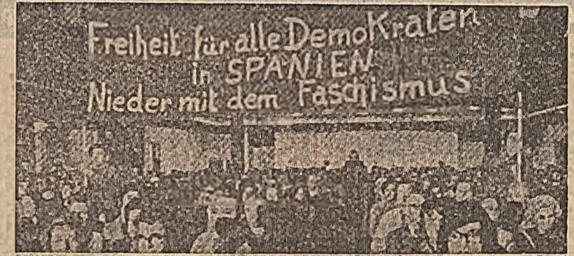
R.F.G. La Gelsenkirchen a avut loc un miting de masă la care au participat muncitorii vest-germani și spaniolii care lucrează în Germania occidentală, în sprijinul amnistierii deținuților politici din Spania.

BELGRAD 7 (Agerpres). Secretarul de stat al Statelor Unite, William Rogers, a sosit vineri la Belgrad, într-o vizită oficială de două zile în Iugoslavia. La aeroport, oșteșea a fost întâmpinat de Mirko Topavac, secretarul federal pentru afaceri externe, și alte persoane oficiale iugoslave.