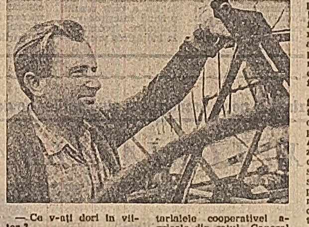
— Cu v-ați dori în vîltoare? — După clișa — momentul de meditație — am să lucrez la mașini complete automatizate...