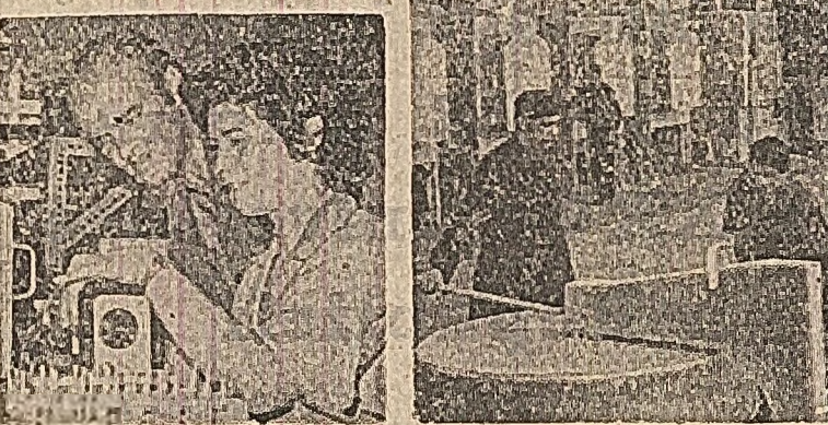
În acest an, colectivul uzinelor "Electronica" din Căpâlnă s-a angajat să producă peste plan 20.000 telefoane. Fiecare lucrător își aduce contribuția pentru îndeplinirea angajamentului.