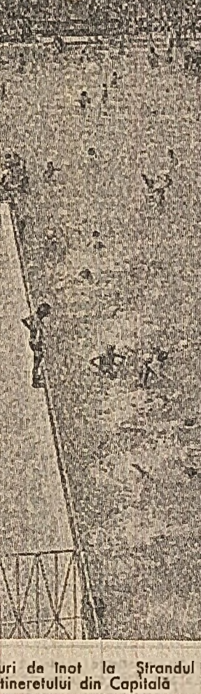
Cursuri de înot la Ștrandul tineretului din Căpâlnă