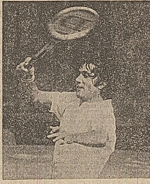
Pe foaja lui Năstase, satisfacția succesului...