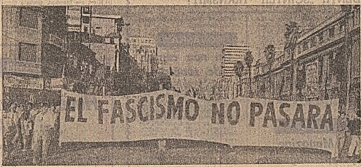
Sub lozincă „Fascismul nu va trece” a avut loc pe străzile orașului Santiago de Chile o amplă manifestare de sprijin pentru guvernul Unității Populare, împotriva onliilor reacțiunii

DELIHI 12 — Trimisul special Agerpres, I. Putineu, transmite: La încheierea celei de-a doua runde de convorbiri, dintre reprezentanții comandamentelor forțelor armate ale Indiei și Pakistanului, care se desfășoară în localitățile de frontieră Suchgaur, la Delhi s-a anunțat că aplicarea măsurilor stabilite pentru delimitarea liniei de control în regiunea Jammu-Cashmir va începe în următoarele cinci zile. Operațiunile privind traducerea în fapt a acestor măsuri vor dura, în total, 20 de zile.