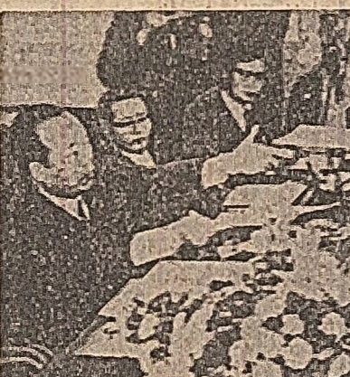
Panmunjon. Aspect din timpul ultimei sesiuni a reprezentanților organizațiilor de Cruce Roșie din Nordul și Sudul Coreei.

Referindu-se la convorbirile la nivel înalt Nord-Sud, în urma cărora a fost dată publicității istorica Declarație comună a Nordului și Sudului, și a spus: „Această înțelegere, în timp ce progresu convorbirilor preliminare între organizațiile de Cruce Roșie nord și sud-coreene, calea dialogului și a contactelor a fost largită și s-a făcut o nouă breșă în bariera care ne desparte”.