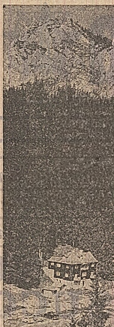
Peisaj la Lacul Roșu

„Cu arăturile de vară stîm bine” apreciază specialiștii de la direcția generală agricolă a județului Alba. Ultimele unități operative confirmă această apreciere. Într-adevăr, pînă în seara zilei de 10 august, în cooperativă agricolă din județul Ilfov, Buzău, Timiș, Prahova, Argeș, Satu-Mare, Bihor etc. Deși recoltarea culturilor premergătoare, respectiv a leguminoaselor și cerealelor, s-a terminat de multă vreme, totuși în unele județe executarea arăturilor de vară se desfășoară în ritm nesatisfăcător. Astfel, în județul Arad au fost arate numai 71 la sută din suprafețele de pe care s-a strîns recolta de cereale: Tulcea — 70 la sută; Dimbovița — 62 la sută; Galați — 52 la sută; Vaslui — 41 la sută; Iași — 39 la sută; Neamț — 34 la sută. Este necesar să fie grabite arăturile și să se întinse prin discuri și grăbiri pentru a se asigura un bun pat germinativ pentru semințele care vor fi sîmînțite în toamnă. Organice și organizațiile de partid, direcțiile agricole și unitățile cooperatiste trebuie să îndrume și să sprijine întreprinderile agricole, pentru a executa la timp și în condiții bune lucrările de pregătire a terenului în vederea însămînțării de toamnă.