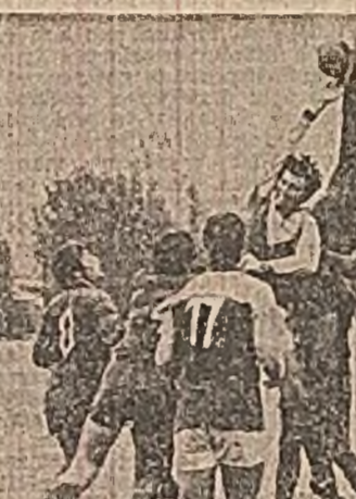
Dispută între incălzări (Fază din meciul Steaua - Politehnica Iași)

Dinamo - Universitatea Craiova, Rapid - U.T.A., F. C. Argeș - Universitatea Cluj, Steagul roșu - Farul, C.F.R. Cluj - Steaua, A.S.A. Tg. Mureș - Sportul studențesc, Jiul - Petrolul, S. C. Bacău - C.S.M. Reșița.