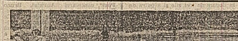
Schiștii, în probele eliminatorii, ieri dimineață pe pista de la Feldmoching