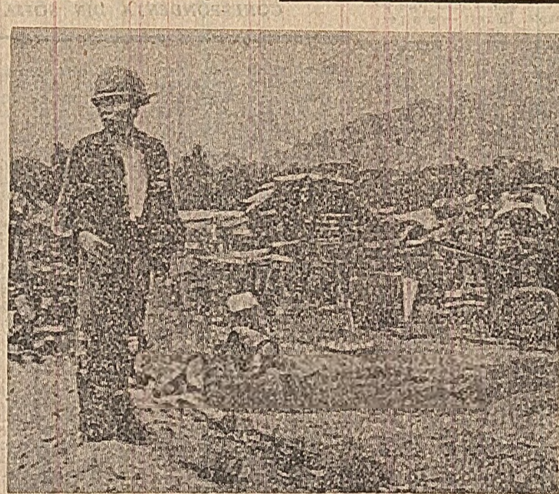
Vietnamul de sud. O poziție a trupelor saigoneze din apropierea localității Que Son distrusă de tirul forțelor patriotice.

În încheiere, mesajul chemă pe intelectuali de extremă dreapta, tinereți, precum și soldații și funcționarii regimului Lon Nol să chibzuțesc serios la realitate: războiul de națiuni, să părăsesc așa-zisa „republică” de la Prom Penh, care se va prăbuși inevitabil. Totodată, mesajul apetează în toți compatrioții care trăiesc în Franța și pe care îi afectează profund suferințele țării și poporului, chemându-i să se unească și să doă dovă de curaj pentru a-și neutraliza pe trădătorii Lon Nol — Son Ngoc Thanh.