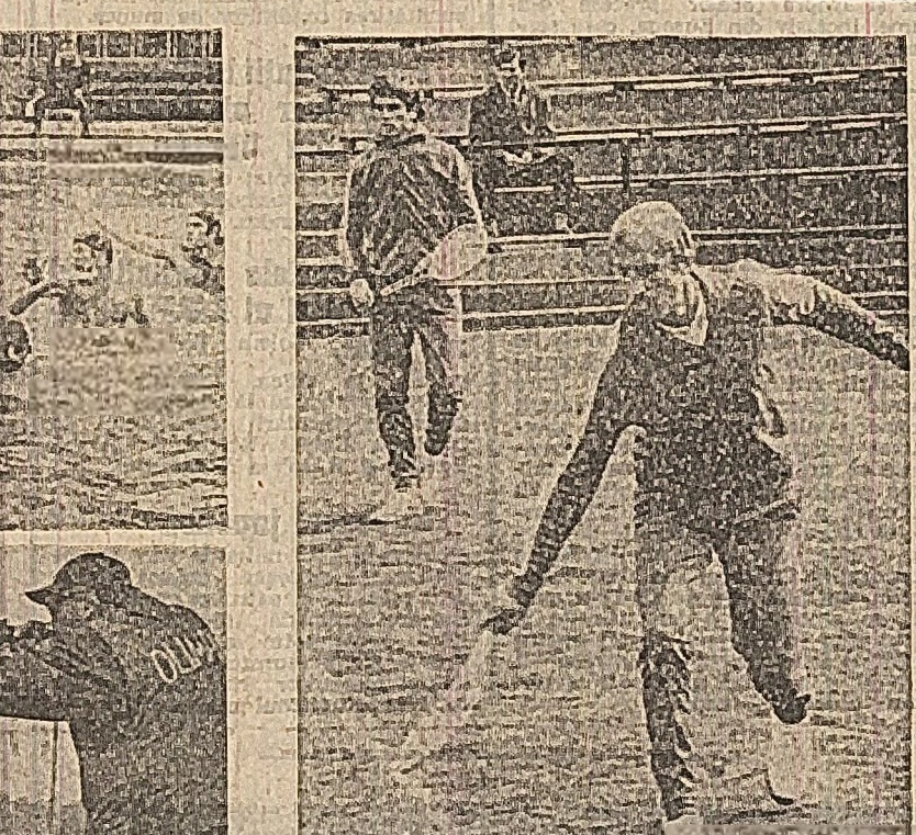
In fotocronica noastră: • Cuplul nord-american Stan Smith - Erik Van Dillen, la antrenament pe terenul „Progresul” (fotografia de sus). • Moment din dezbateri campionatul de polo: Dinamo - Rapid (sिंगa - sus).