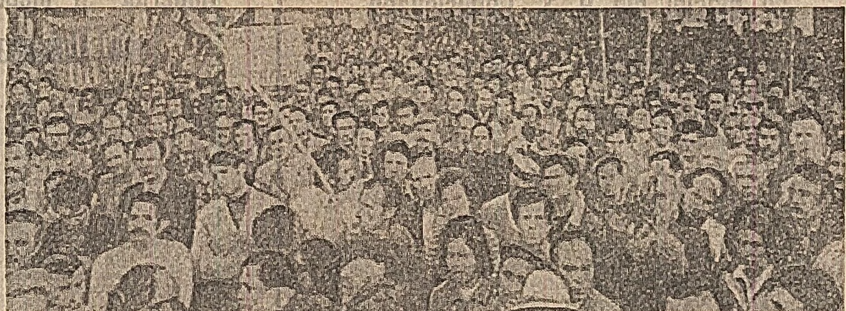
Demonstrație a muncitorilor constructori din Torino (Italia) în sprijinul revendicărilor de sporire a salariilor și îmbunătățirea condițiilor de muncă

HANOI 14 (Agerpres). — După cum transmite agenția V.N.A., în 22 octombrie, avioane americane au participat la o operațiune de blocare cu mine a porturilor R. D. Vietnam și au atacat numeroase localități populare din mai multe provincii ale R.D. Vietnam. În aceeași zi, avioane „B-52” au bombardat localități din provinciile Nghe An, Ha Tinh și Quang Binh, iar nave de război ale S.U.A. au deschis focul fără discriminare asupra unei stațiuni balneare și altor localități de pe coasta provinciei Thanh Hoa. Bombardamentele au provocat moartea și rănierea a numeroși civili, distrugerea sau avarierea unor case de locuit și a altor bunuri civile. Un purtător de cuvânt al Ministerului Afacerilor Externe al R.D. Vietnam a dat publicității o declarație