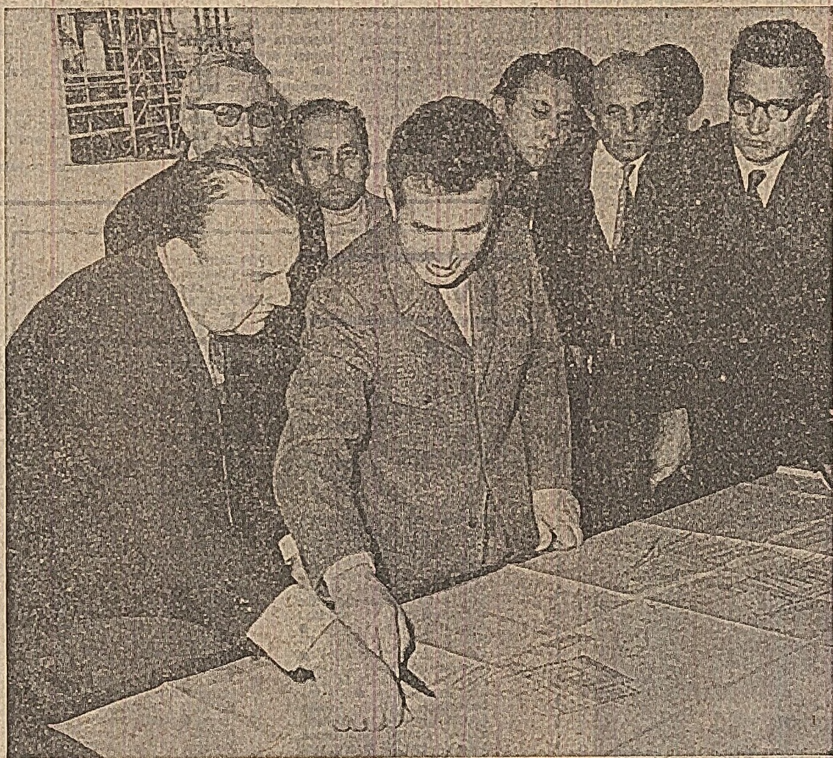
Secretarului general al partidului îi sînt prezentate schițele privind perspectivele de dezvoltare a uzinei

Sîmbătă, 14 octombrie, tovarășul Nicolae Ceaușescu, secretar general al partidului Comunist Român, președintele Consiliului de Stat al Republicii Socialiste România, a făcut o vizită de lucru la Uzina de utilaj chimic din Ploiești.