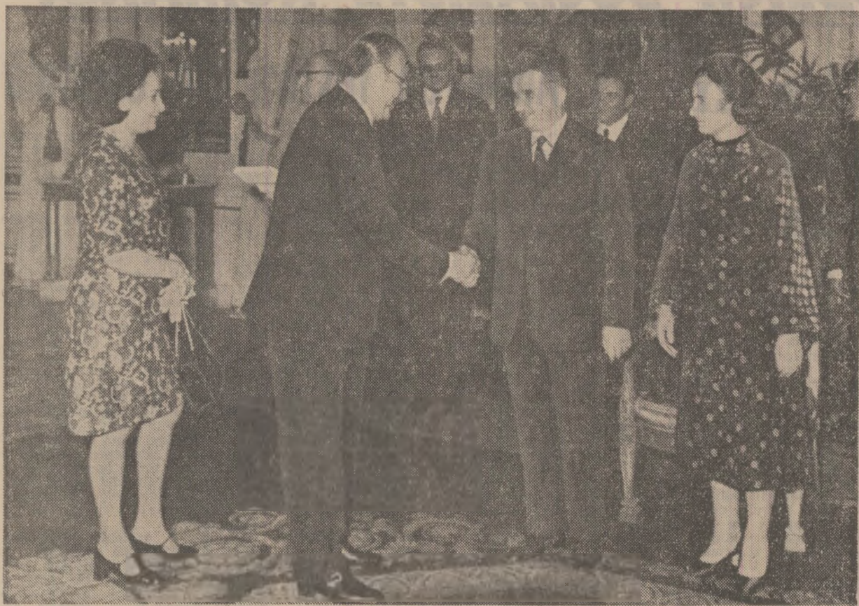
Întâlnire cu corpul diplomatic, în spiritul înțelegerii și colaborării internaționale