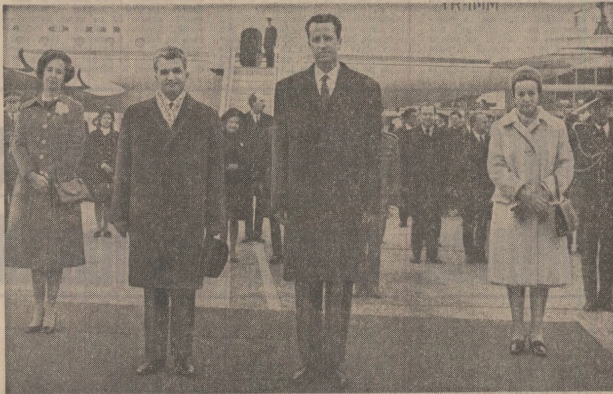
La sosire, pe aeroportul din capitala Belgiei