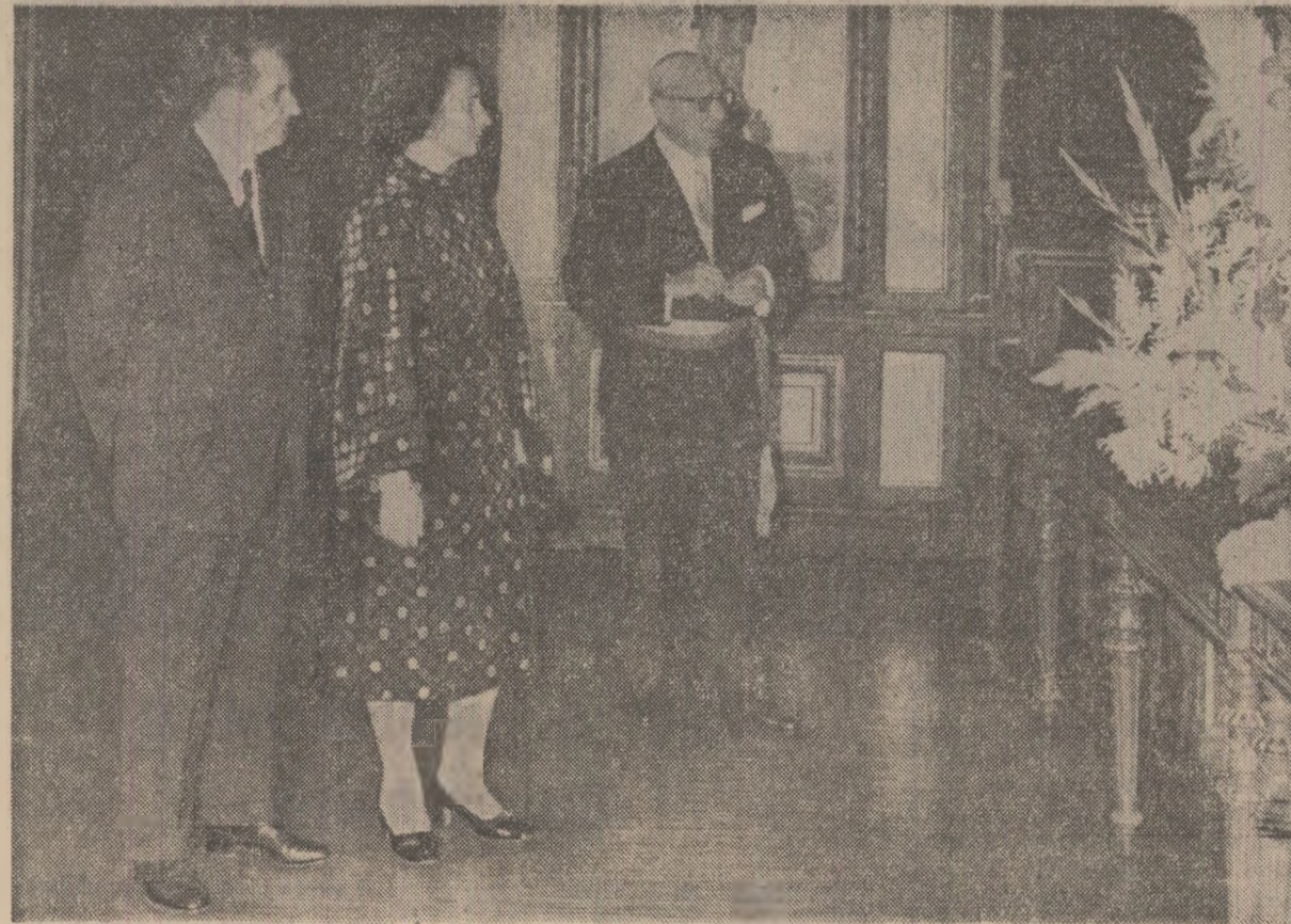
Moment al primirii la primăria din Bruxelles