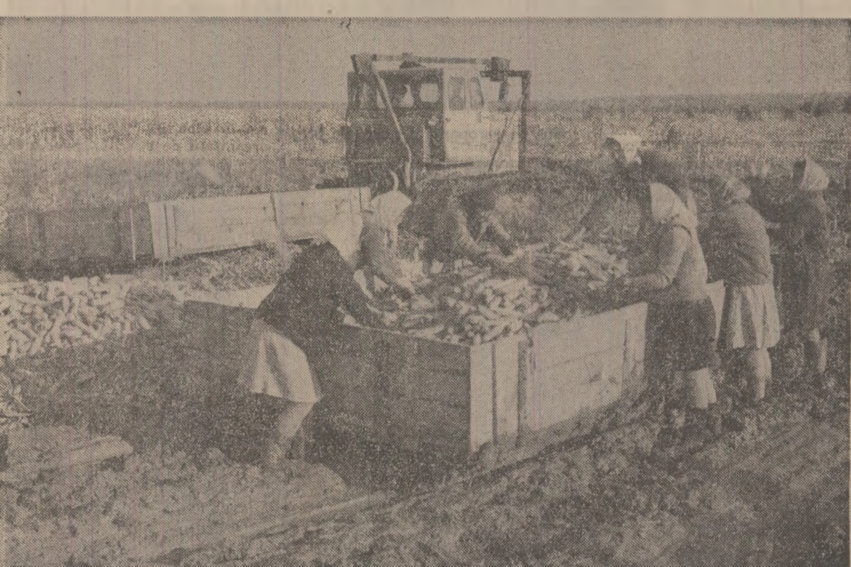
Cînd există dorința de a face totul pentru a pune la adăpost recolta se găsesc cele mai ingenioase soluții. Iată o inedită... sanie de noroi. Au născocit-o cooperatorii din Comșani-Dimbovița, pentru a scoate de pe terenurile băltoșe, pînă la drumul accesibil camioanele, porumbul recoltat

ÎN JUDEȚUL OLT, o primă constatare: însămînțarea grîului este întîrziată. Pînă în ziua de 24 octombrie s-au semănat doar 135 ha din cele 83.000 prevăzute. Intrucît sînt zone în care se poate lucra intens, la indicația biroului comitetului județean de partid, 360 tractoare echipate cu grape și discuri, 235 cu semănători, 275 cu pluguri au fost dirijate din nord în sud. Altă măsură se referă la organizarea schimbului II și executarea tuturor lucrărilor pregătitoare și de însămînțări în schimburi prelungite și pe timpuri de noapte, asigurarea hranei calde în cîmp mecanizatorilor și membrilor cooperativelor care deservesc maslinele agricole etc. În vederea folosirii mai eficiente a tractoarelor, în stațiunile pentru mecanizarea agriculturii Drăgănești-Olt, Vîșina și Caracal s-au făcut cunștii de cele trei semănători. Sînt 29 care sînt tractate de un singur tractor. Se realizează astfel o viteză zilnică sporită de 28-30 hectare față de 10-12 hectare cit se însămînțează cu o singură semănătoare S.1. 29. Astfel, în cooperativele agricole Drăgănești-Olt, Sîceni, Vîșina Vechie și altele s-a înregistrat un ritm