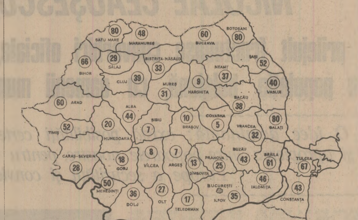
Situația însemînatului grîului pe ogarele cooperativei agricole la data de 24 octombrie a.c.

can, directorul general al direcției agricole a județului. În razi Conșiliului intercooperatist, Crasna, de pildă, din 3 600 hectare nu s-au însemînat cu grîu decît 1 000 de hectare. În ultimele zile, în fiecare cooperativă s-au luat măsuri concrete pentru grăbirea lucrărilor. Este vorba de amplasarea mai bună a culturii pe terenuri zîvinate, pregătirea terenului și noaptea etc. În acest fel ne-am propus să sporim viteza zilnică de la 1 500 la 3 000 de hectare.