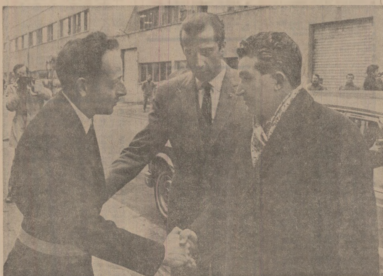
Primarul orașului Arlon salutînd călduros sosirea oaspeților români