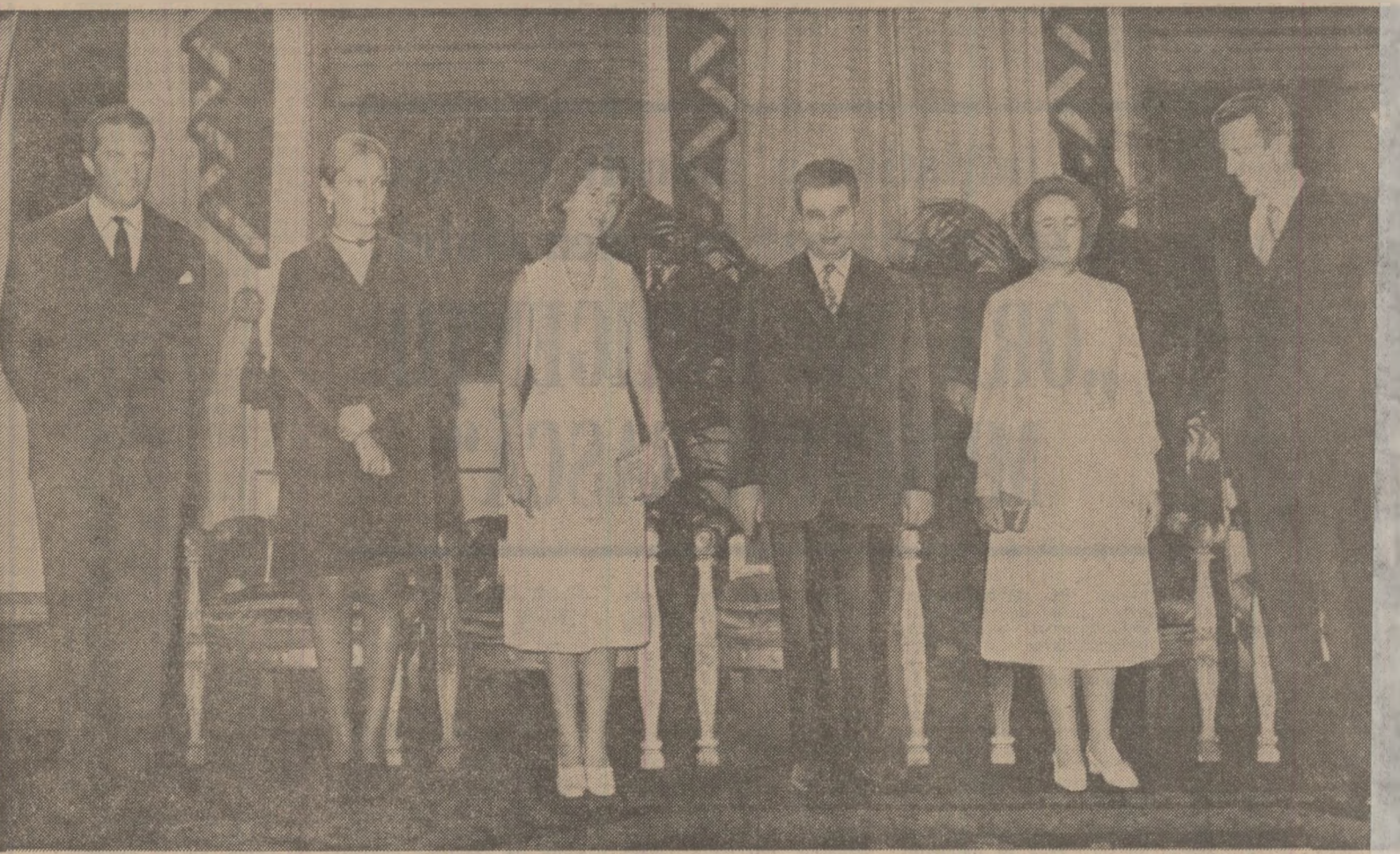
Moment din timpul dîneului oferit de suveranii belgieni în prima zi a vizitei