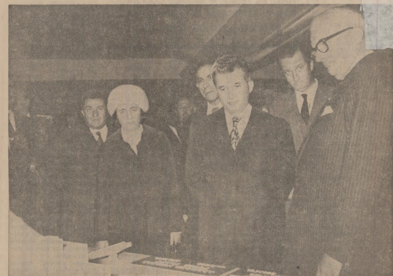
La Atelierele de construcții electrice din Marcinelle