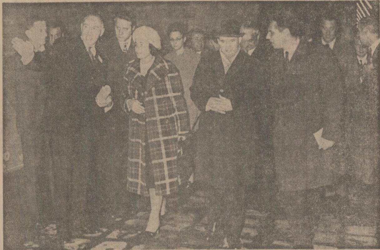
Se vizitează întreprinderea „La Cellulose des Ardennes”