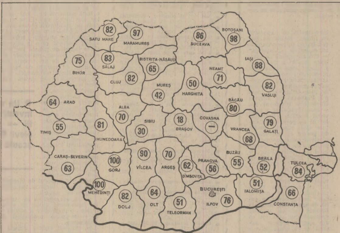
Situația recoltării porumbului, în cooperativele agricole, la 31 octombrie a.c.

Din datele centralizate în cursul zilei de 31 octombrie a.m. n. rezultă că au mai rămas de însămînțat peste 840 000 hectare cu grâu și seară. Pentru a se însămînța în timpul cel mai scurt toate suprafețele destinate grâului se impune ca în aceste zile — hotărâtoare pentru nivelul viitoarei recolte — să se realizeze o viteză de lucru sporită, fără a se neglija calitatea. Ce se întreprinde în această direcție?