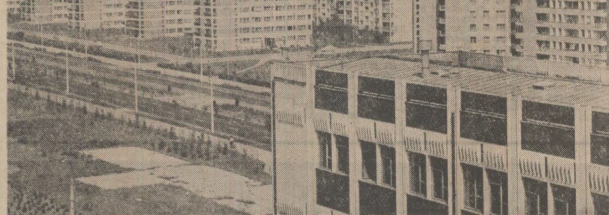
Metafore din beton și sticlă în cartierul Balta Albă din Capitală

Un grup de salariați din cartierul Titan