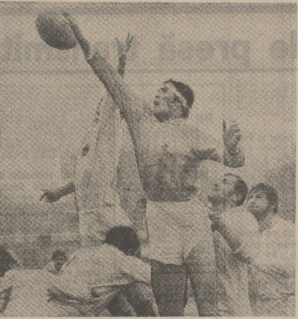
Equalitatea la „prindere” este doar aparentă; balonul revine — ca de obicei — rugbiştilor oaspeţi (fază din meciul de ieri, România-R.F.G.)