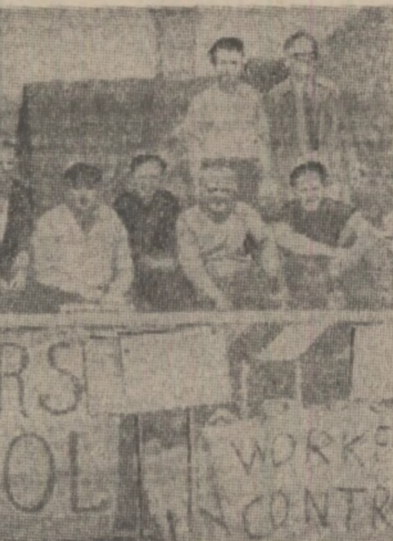
„Muncitorii din control” — o lozincă semnificativă pe peretii unei întreprinderi din orașul englez Basingstoke. Muncitorii au ocupat întreprinderea, protestînd împotriva intenției patronilor de a vinde unui concern american

Președintele Indoneziei, generalul Suharto, a plecat într-un turneu prin mai multe țări ale Europei. Însotit de ministrul afacerilor externe, Adam Malik, el va sosi în cursul zilei de luni la Paris, prima etapă a turneului său de două săptămîni.