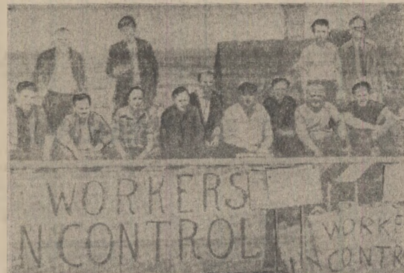
„Muncitorii din control” — o lozincă semnificativă pe peretii unei întreprinderi din orașul englez Basingstoke. Muncitorii au ocupat întreprinderea, protestînd împotriva intenției patronilor de a vinde unui concern american

Reuniunea I.A.T.A. Reprezentanții a 31 de companii de transport aeriene membre ale I.A.T.A. (Asociația de transporturi aeriene