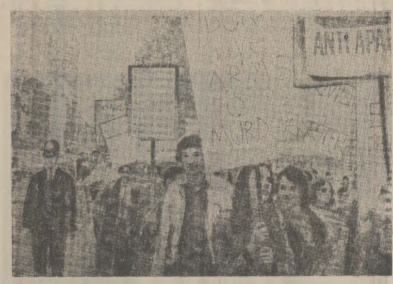
Londra. Manifestație a populației din capitala britanică împotriva livrării de arme către Republica Sud-Africană și a politici de apartheid practicate de guvernul acestei țări

Analizînd condițiile expansiunii industriei de ceasuri japoneze și americane, specialiștii scot în relief faptul că, în primul rînd, este vorba de costul scăzut al ceasurilor respective. Este de notat faptul că, o dată cucerită piața, cele două mari firme, Timex și Hattori, au început să-și schimbe politica, fabricînd ceasuri de înaltă precizie, la prețuri foarte ridicate (ultimul model desăfășurat pe piața europeană de Hattori costă nu mai puțin de 2 880 franci). Europeanii însă au început drumul în sens invers, contracarînd tocmai pe termen lung au fost depășiiți. Fabricanții elvețieni, care se bucură încă de un mare prestigiu pe piața mondială, au pus la punct un ceas în întregime din plastic, care revine la un preț foarte redus. Totodată, Elveția a adoptat o serie de măsuri mai liberale ce permit fabricanților francezi, germani, italieni, cărora le furnizează o serie de piese, să poată grava pe produsele lor inscripția de prestigiu „Swiss made”. Vor fi aceste măsuri în stare să „înceteze mersul ceasornicilor” gigantilor de peste Ocean? A. B.