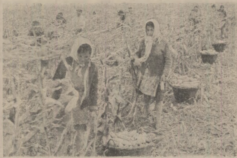
În aceste zile, la I.A.S. Cogealac, județul Constanța, s-au mobilizat toate forțele pentru strângerea porumbului de pe ultimele suprafețe