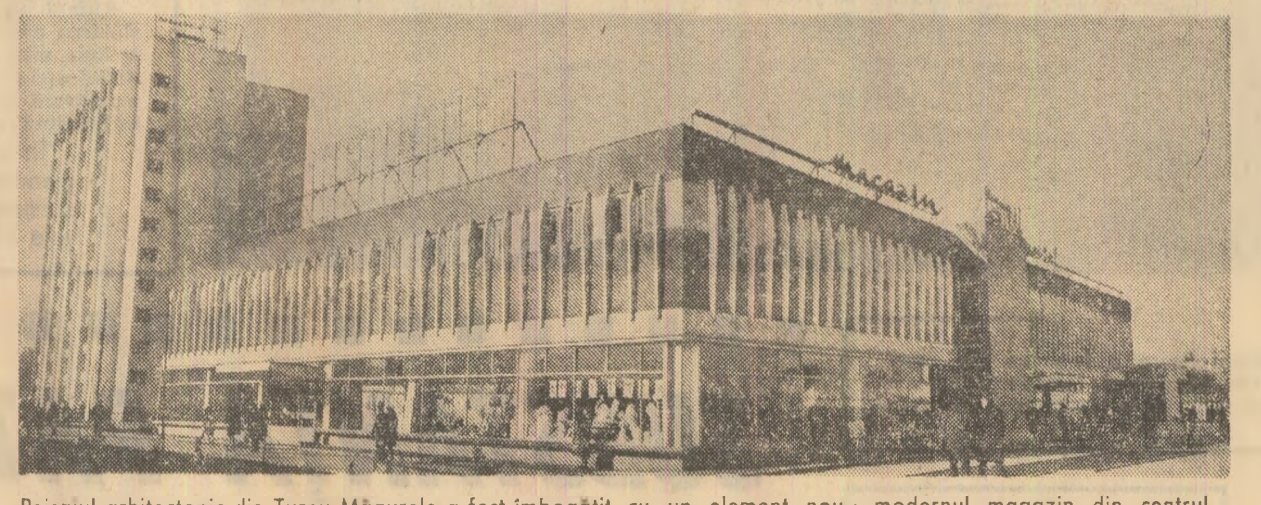
Paisajul arhitectonic din Turnu Măgurele a fost îmbogățit cu un element nou: modernul magazin din centrul orașului