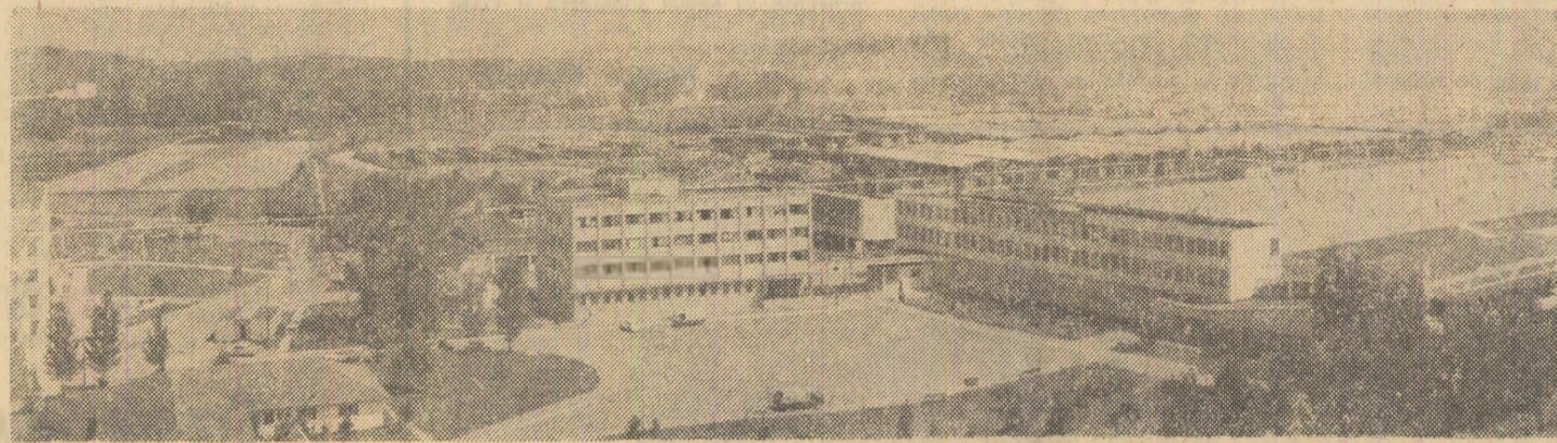
Combinatul de exploatare și industrializare a lemnului din Pitești este una din unitățile de frunte ale economiei forestiere și ale județului Argeș. În fotografie: o imagine de ansamblu a combinatului