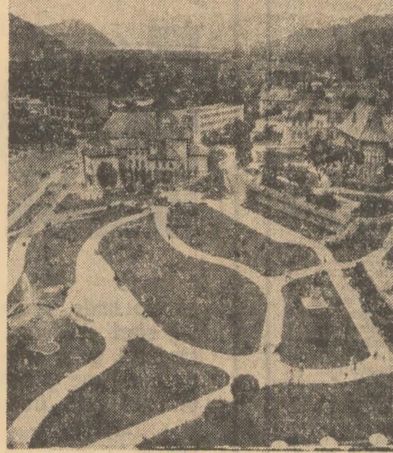
Imagine pitorească din Piatra Neamț