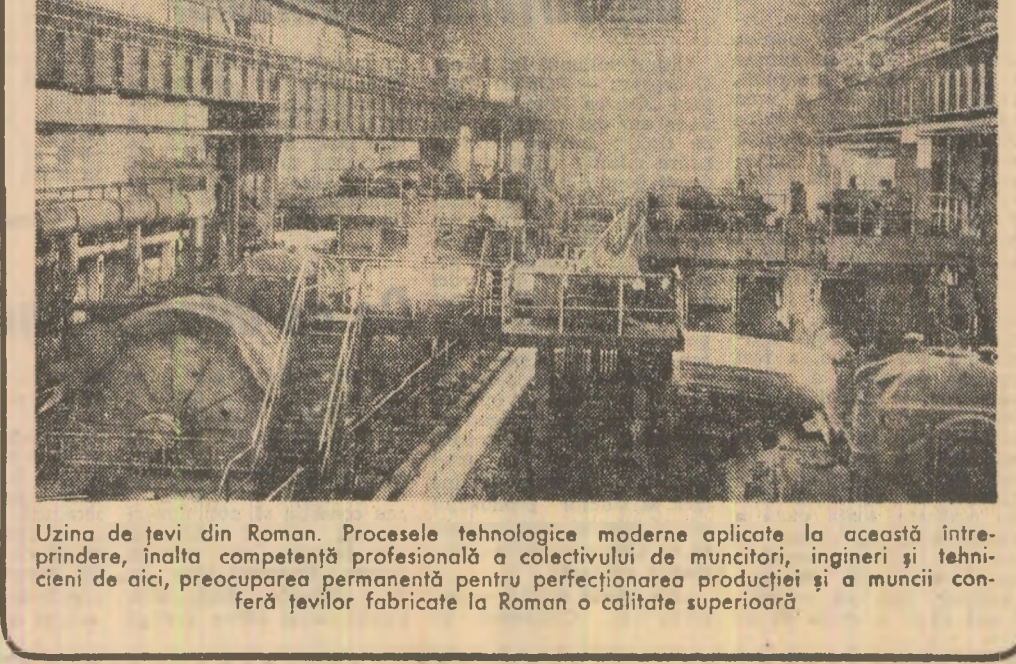
Uzina de țevi din Roman. Progresele tehnologice moderne aplicate la această întreprindere, înalta competență profesională a colectivului de muncitori, ingineri și tehnicieni de aici, preocuparea permanentă pentru perfecționarea producției și a muncii conferă țevilor fabricate la Roman o calitate superioară.