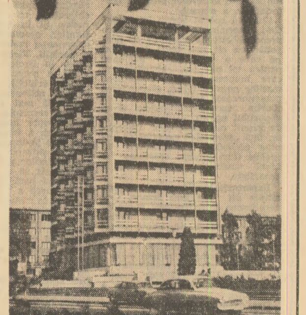
Hotelul care poartă numele orașului în care își profilează silueta: „Galați”

ALEXANDRU MURĂȘU, corespondentul „Școlii”