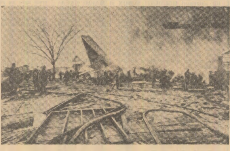
După cum s-a mai anunțat, un avion de tip „Boeing 737”, aparținând companiei americane „United Airlines”, s-a prăbușit într-un cartier al orașului Chicago. În fotografie: imagine de la locul catastrofei

Ploi torențiale din India. Peste 30 de persoane și-au pierdut viața în urma ploilor torențiale care s-au abătut, în această săptămână, asupra statului Tamil Nadu din sudul Indiei. Au fost înregistrate însemnate pagube materiale. Peste 25.000 de oameni au rămas fără locuințe. Autoritățile locale indiene au luat măsuri grabnice pentru înlăturarea urmărilor pricinuite de ploi.