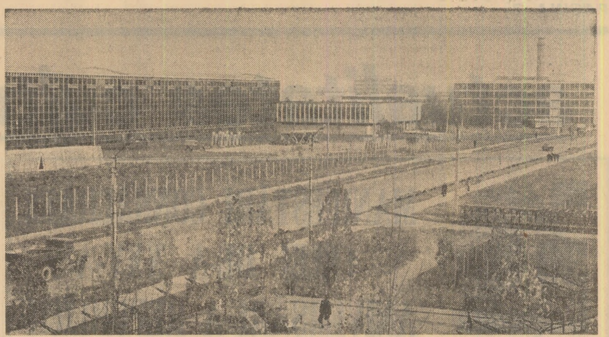
Vedere parțială a zonei industriale Militari-București

... Cît puteai cuprinde cu ochii — numai deauri și rîpe galbene, pline de vîntoase. Mii de hectare de teren arid, iarna potopit de zăpezi, vara sîrîncat de ape. Unii dintre localnicii din Bujor, au fost îndrăgii și Corn erau de părere că mai degrabă poți scoate apă din piatră seacă decît să găsești pe aceste dealuri o palmă de pămînt bun de sană. Fertilizarea unui asemenea teren, absent dintr-o dată din registrele agricole, presupunea soluții originale de lucru, o mare concentrare de forțe și o cotă de risc, incalculabilă. „Cînd am trecut în zilele trecute pe sub poala fostelor dealuri și rîpe am avut impresia că merg pe hotarul unei ferme model. Cît puteai cuprinde cu ochii — numai livezi cu pomi fructiferi tineri, vită de vie, Mi-au rămas în viață în mînta cîntecelor esențiale în jurul cărora gravitează toate celelalte impresii. 1) La Galați nu s-a lansat pește noaptea un îndemnat suport pentru valorificarea resurselor locale. Comitetul Județean de partid, consiliul popular județean au pus în discuție publică o problemă de cel mai mare interes cetățenească. 2) Resursele locale depășite au fost și sint valorificate superior, economicos. 3) Aprovizionarea populației pe baza resurselor proprii județului nu are un caracter de campanie. Este o acțiune permanentă, care la mureau angloare și e urmată de oame-