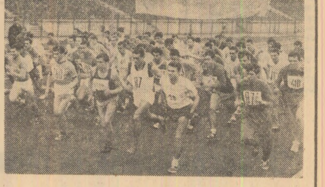
Start în finala crosului „Dinamo”

● FOTBAL — Penultimă etapă a turului diviziei A ● VOLEI — La jumătatea întrecerii în competițiile masculine și feminine ● TRINTĂ — Finala Campionatului național sătesc Alte știri și rezultate sportive în pagina a III-a