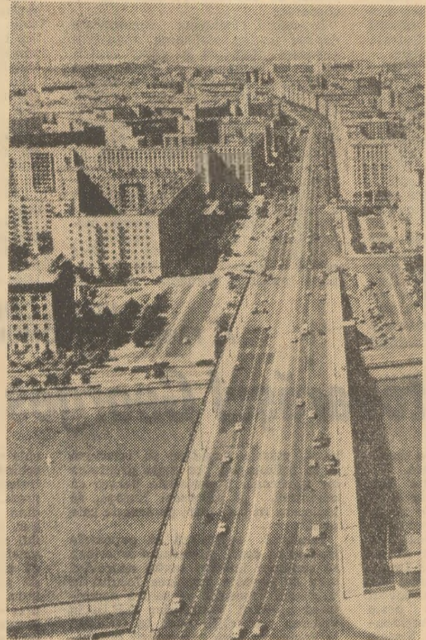
Pe una din arterele Moscovei