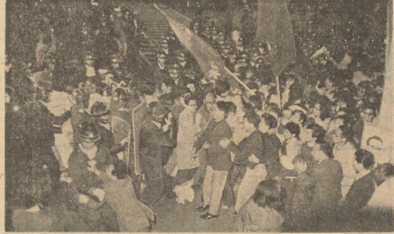
Japonia. Circa 10.000 de persoane au demonstrat în portul Yokohama împotriva transporturilor de material de război american către Vietnam. În fotografie: ciocnire între manifestanți și poliție

În seara zilei de 14 decembrie, Le Duc Tho și Xuan Thuy, conducătorul delegației R.D.V., au avut o întrevedere cu Nguyen Thi Binh, conducătorul delegației Guvernului Revoluționar Provisional al Republicii Vietnamului de Sud și cu alți membri ai acestei delegații la convorbirile de la Paris.