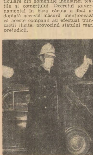
Roma. Accentuarea poluării atmosferice, mai ales datorită gazelor de eșapament ale vehiculelor auto, îi determină pe agenții de circulație din punctele mai oglomerate să folosească măști protectoare