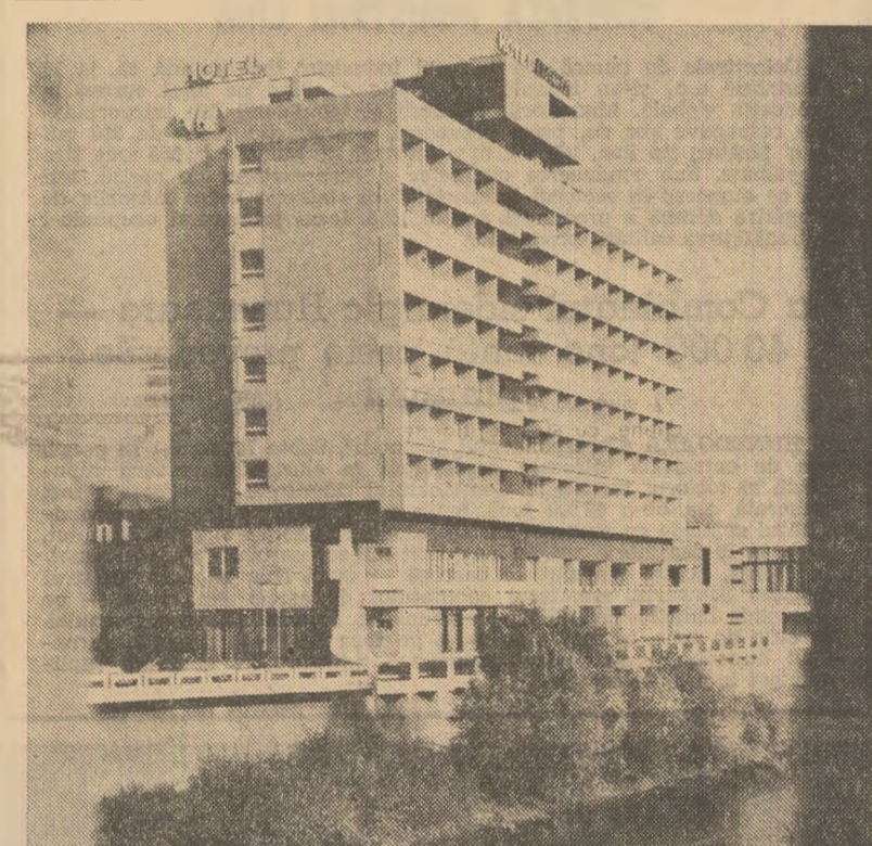
Hotelul „Dacia” din Oradea

„Raportăm cu satisfacție — se arată, între altele, în telegrama adresată de Conferința organizației municipale Drobeta Turnu-Severin a P.C.R. — că oamenii muncii din acest municipiu, în frunte cu comunistii, și-au îndeplinit și depășit sarcinile de plan, iar pînă la sfîrșitul anului își vor realiza și depăși angajamentul, luate dintr-o producție suplimentară de peste 100 milioane lei, concretizată în circa 100 milioane kWh energie electrică, 600 tone de construcții metalice, 370 mc de cherestea din fag și rășinoasă, 128 mc de placaj, mobila în valoare de peste 2,5 milioane lei, 600 tone de confecții din carton ondulat, 1.000 tone de carne, 900 tone de semăncinuri și preparate de carne, și vor economisi 500 tone de metal și peste 8.200 tone de combustibil convențional.