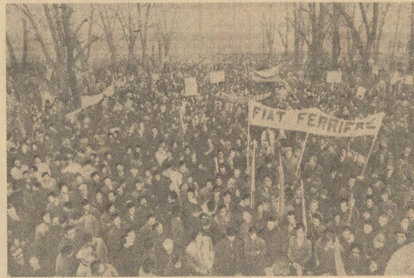
Italia. La Torino a avut loc o mare manifestație a muncitorilor de la uzina „Fiat” pentru apărarea locurilor de muncă și îmbunătățirea condițiilor de viață

Agenda de presă informează că această este a doua „grevă politică” care afectează cotidienele britanice, în cursul acestui an. Se reaminteste astfel, că în luna iulie a. c., în Maracaibo, nu au apărut ziar timp de o săptămână, cind tipografii au declarat grevă în semn de solidaritate cu docherii areștați.