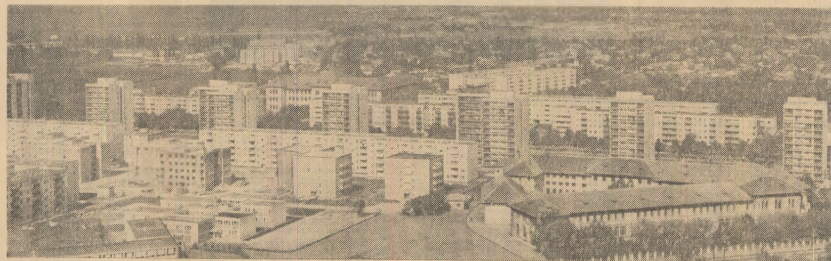
Buzău — un municipiu care a cunoscut, în ultimii ani, ca dealtfel toate localitățile patriei, trecerea directă la industria cea mai avansată. Dezvoltarea sa economică a determinat mutații extrem de rapide în urbanistică, în viața socială și culturală a orașului, devenit azi un oraș modern, cu culori luminoase, exuberanți și finiri. În fotografie: Vedere panoramică a orașului

Teatrul o școală, iată un adevăr ajuns loc comun. Totuși, acest adevăr are nevoie de nuanțări, de disociații. Fîlinda, deși „școală”, deși „tribună”, scena e o școală care ne „învață” după reguli proprii. Nu transmite noțiuni, învățăminte, provoacă emoții și crează spectacolul prilejului unor meditații rascolitoare, pline de consecințe morale. Prin acest ultim aspect, rostul pedagogic al teatrului se încarcă de grave responsabilități. Pentru că nu ne poate fi indiferent la ce mediu îl invităm publicului nostru, și ce idealuri etice îi propunem.