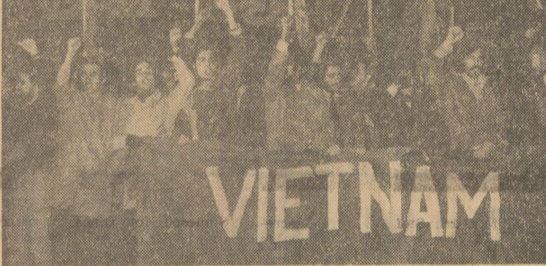
Roma: Demonstrații cerind semnarea acordului de pace și încetarea războiului în Vietnam

„Domn dîna” a declarat că în continuare ministrul adjunct de externe — ca înleptucina sa preveleze, în loc de a se securge la forță, să fie reluate imediat negocierile