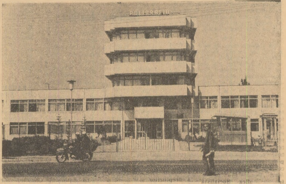
În albumul celor mai reușite fotografii înfățișînd Sibiu contemporan, Fred Nuss ne propune, pe bună dreptate, recenta realizare industrială: întreprinderea pigligrifică