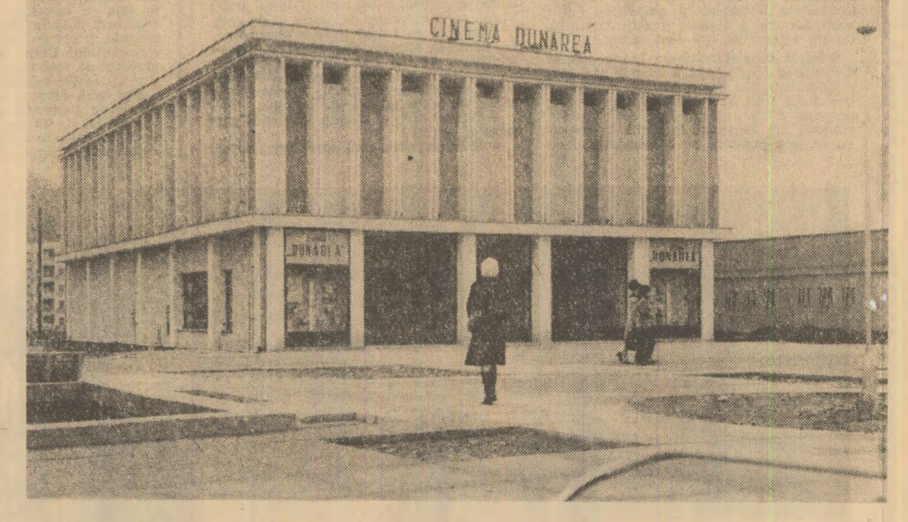
Noul cinematograful din Orșova.

cări au vizat posibilitățile de raționalizare a fluxului informațional-economic la I.T.S. „Progresul”, rezultate ca urmare a cercetărilor științifice întreprinse de colectivul catedrei noastre de contabilitate, im- — Laboratorul economic de contabilitate, recent înființat, oferă studenților o serie de posibilități noi pentru lărgirea cunoștințelor lor de specialitate. Dintre acestea, am menționa punerea la dispoziția acestora,