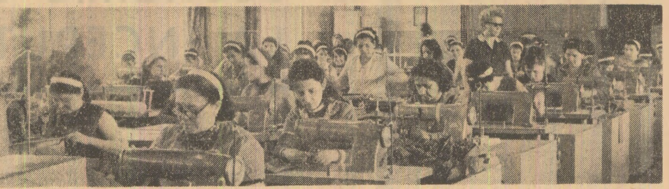
„Mondial“, nume intru totul justificat de renumele fabricii de confecții din Satu-Mare, cunoscută pe multe meridiane ale globului. Pînă la sfîrșitul anului, fabrica va da o producție-marfă suplimentară de 62 milioane lei, adică cu 22 milioane lei peste angajamentul de 40 milioane lei, care a fost realizat