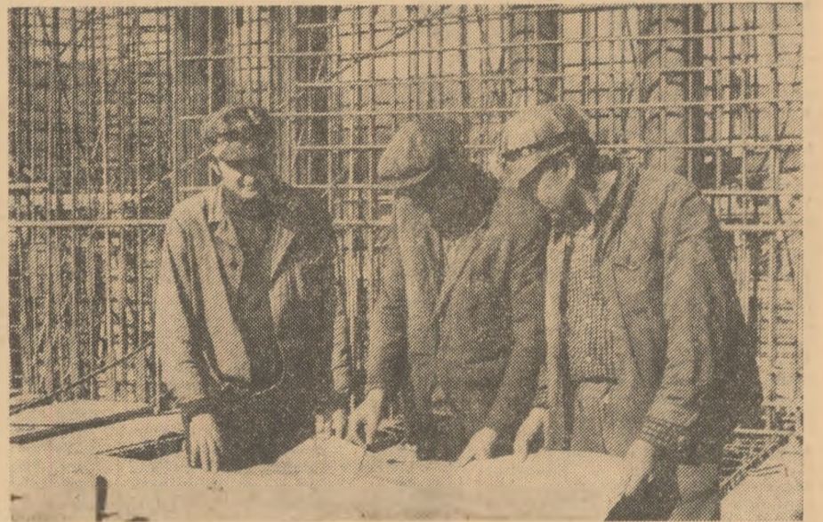
am ales această secvență grăitoare pentru trecerea de la „scara“ planșetei, la „scara“ realității, pe șantierul hidrocentralei din preajma orașului