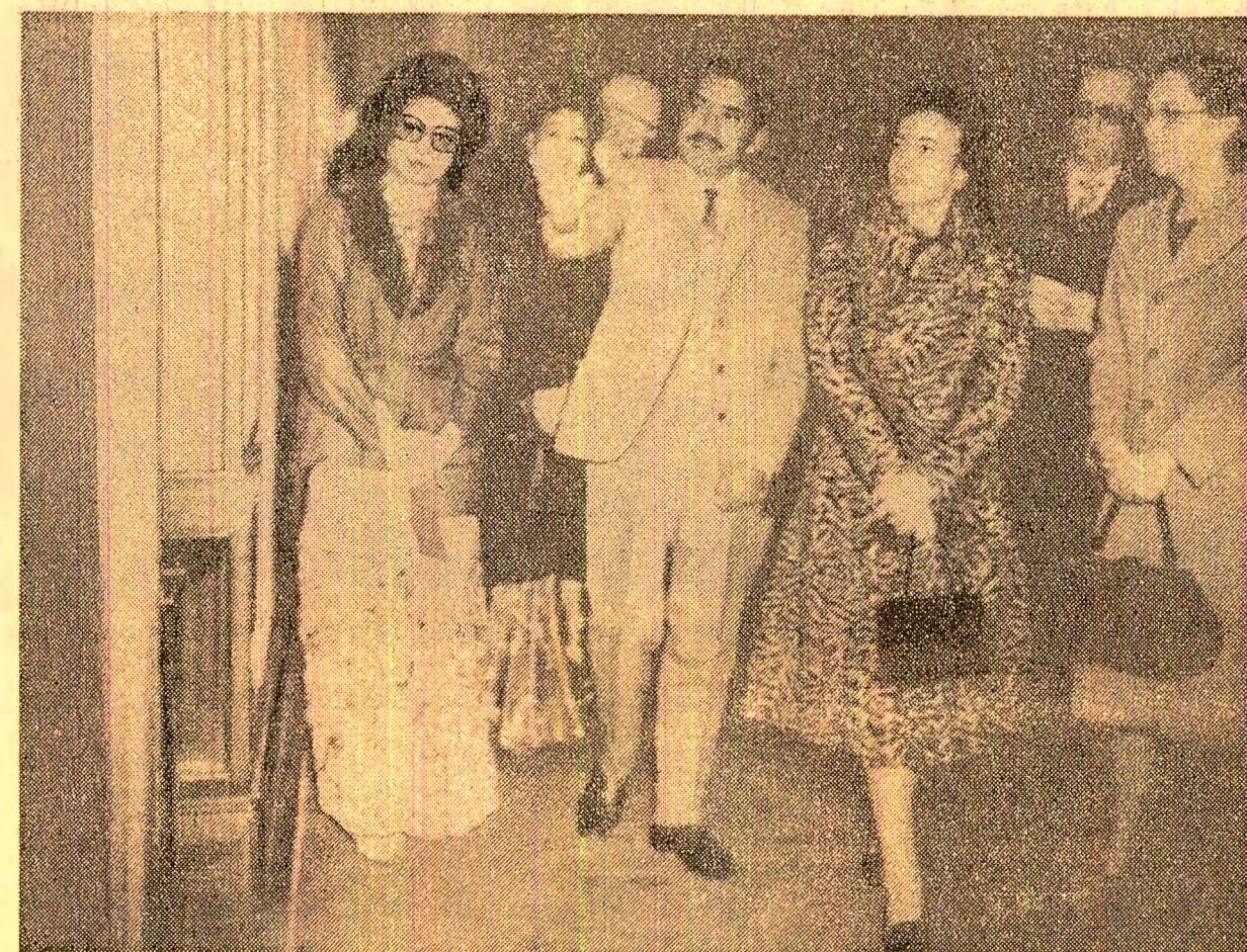
În timpul vizitei muzeului

Este pentru mine o mare plăcere să propun să închinăm cu toții un pahar pentru eroiul popor român, pentru prietenia veșnică între poporul pakistanez și poporul român, pentru președintele României, Nicolae Ceaușescu, și pentru doamna Ceaușescu, pentru toți stimații noștri prieteni din România. (Vii aplauze).