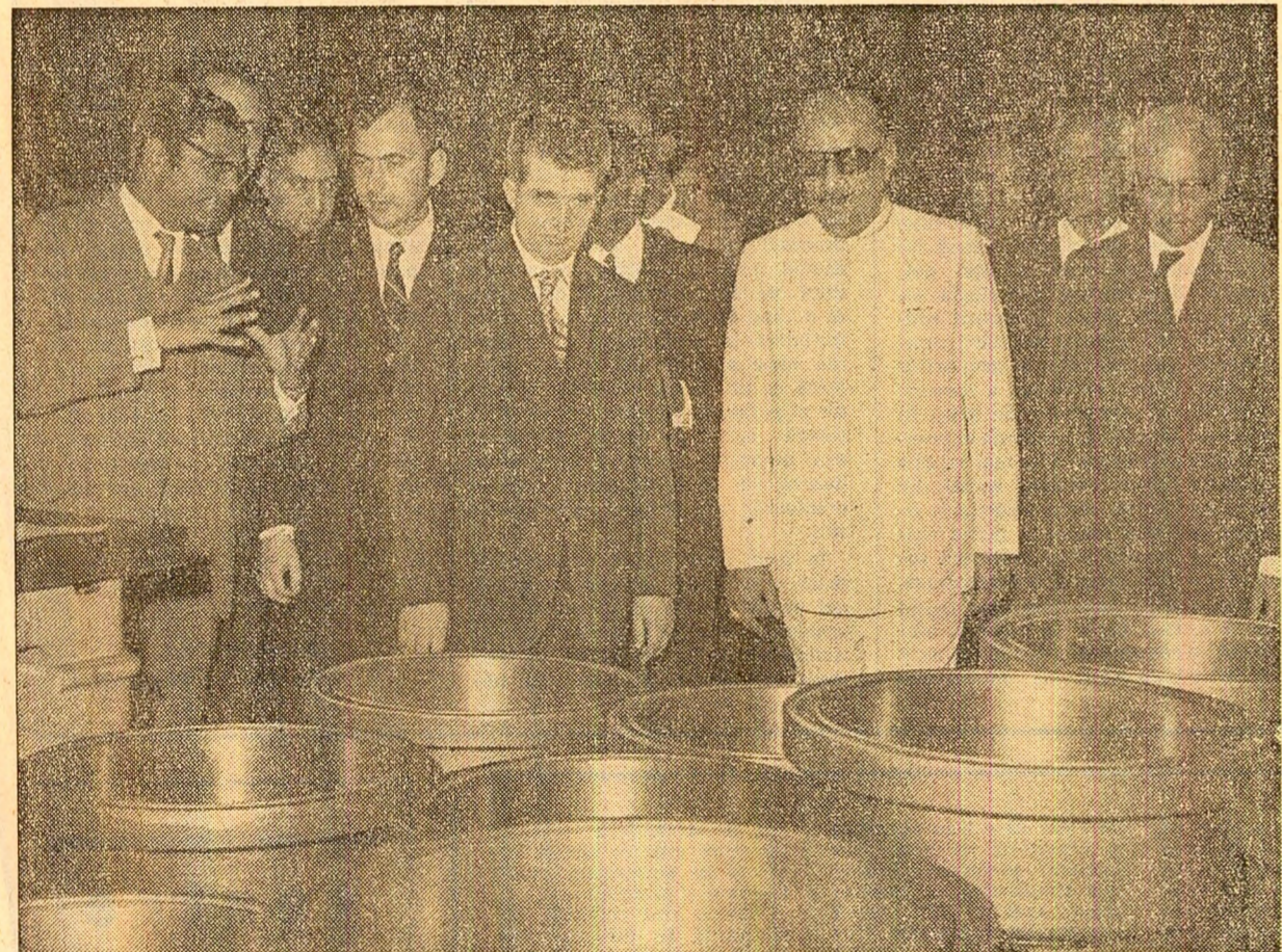
În timpul vizitei la uzina de mașini-unelte „Pakistan”