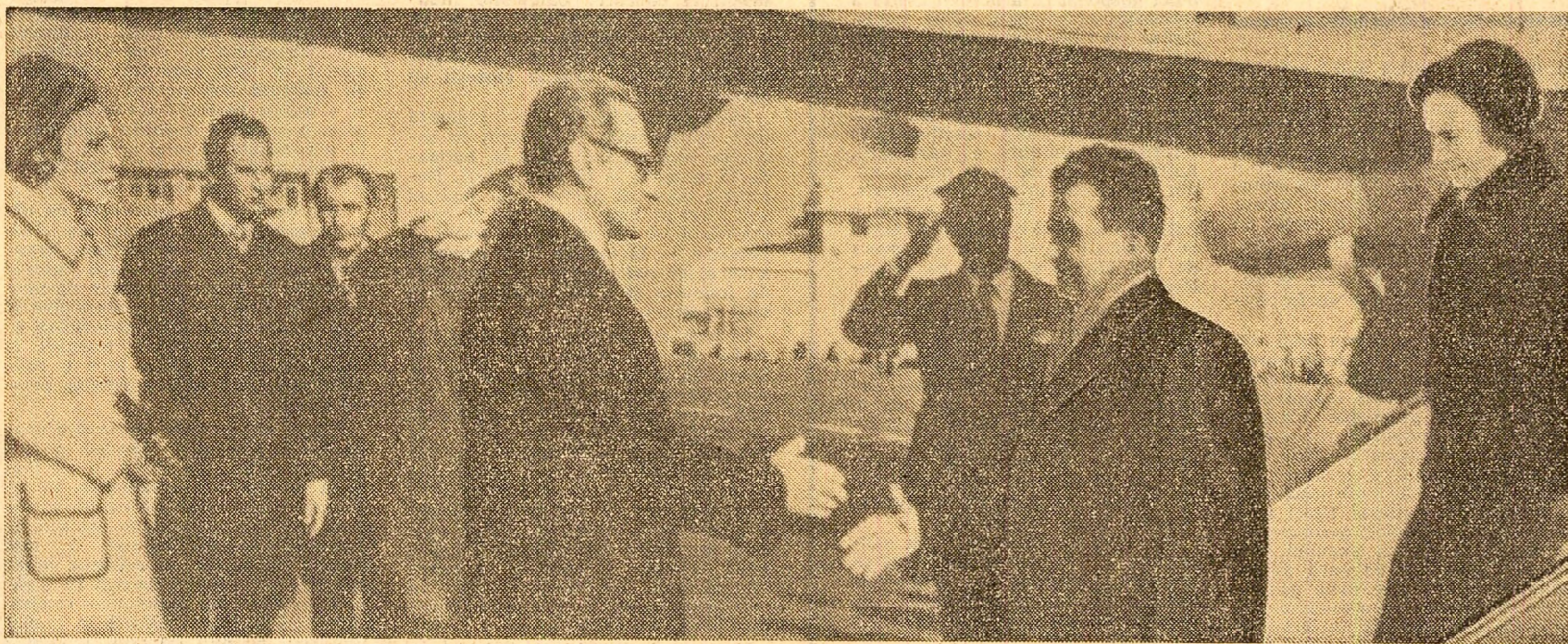
La sosirea pe aeroportul Mehrabad din Teheran

Într-o vizită neoficială, salutat cu căldură, în spiritul tradiționalelor sentimente de prietenie româno-iraniene