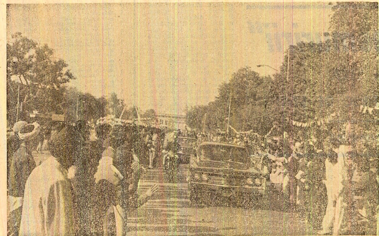
Înălți oaspeți salutați cu căldură de mii de locuitori ai orașului Lahore