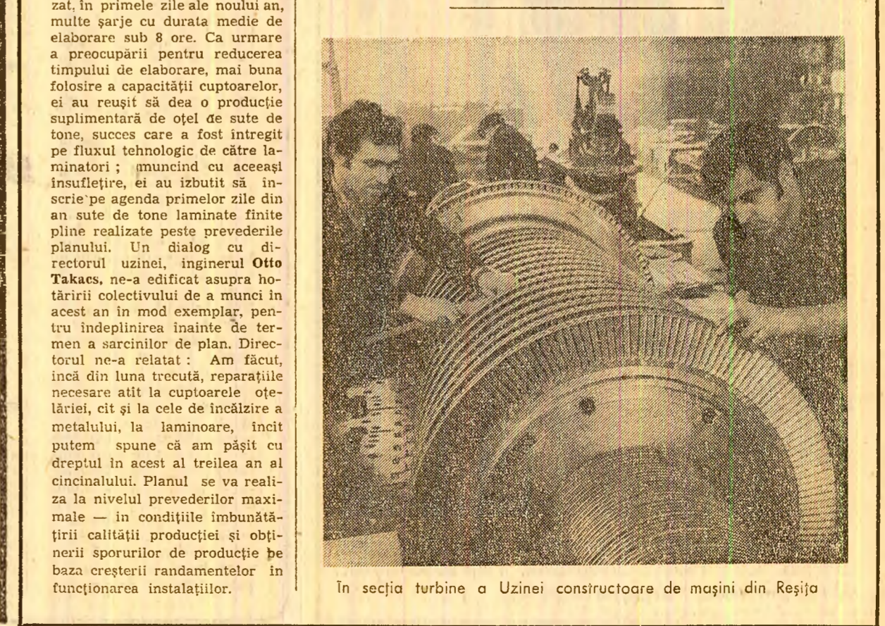
În secția turbine a Uzinei constructoare de mașini din Reșița