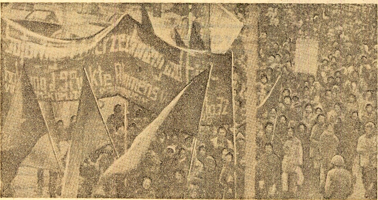
R. F. a Germaniei: Demonstrația la Bonn, pentru încetarea războiului din Vietnam