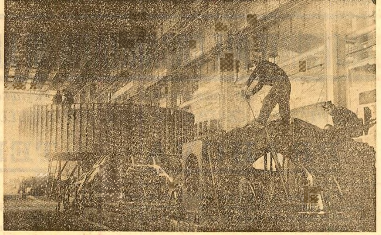
La Uzina de mașini grele din Capitală se fabrică cel mai complex produs industrial din țară: turboagregatul energetic de 330 MW. În imagine: aspectul din secția mecano-sudură, unde se realizează subansamblele turboagregatului gigant

• Manifestări omagiale Petrii • Moment evocator consacrat Unirii Principatelor • Noi aparitii editoriale • Scena • Ecran • Expoziții • Concerte