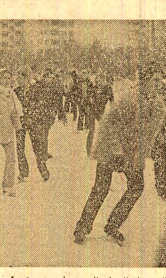
Patinajul este plăcut, chiar dacă afară viscoleşte (ieri dimineață, la patinoarul de la Floreasca)