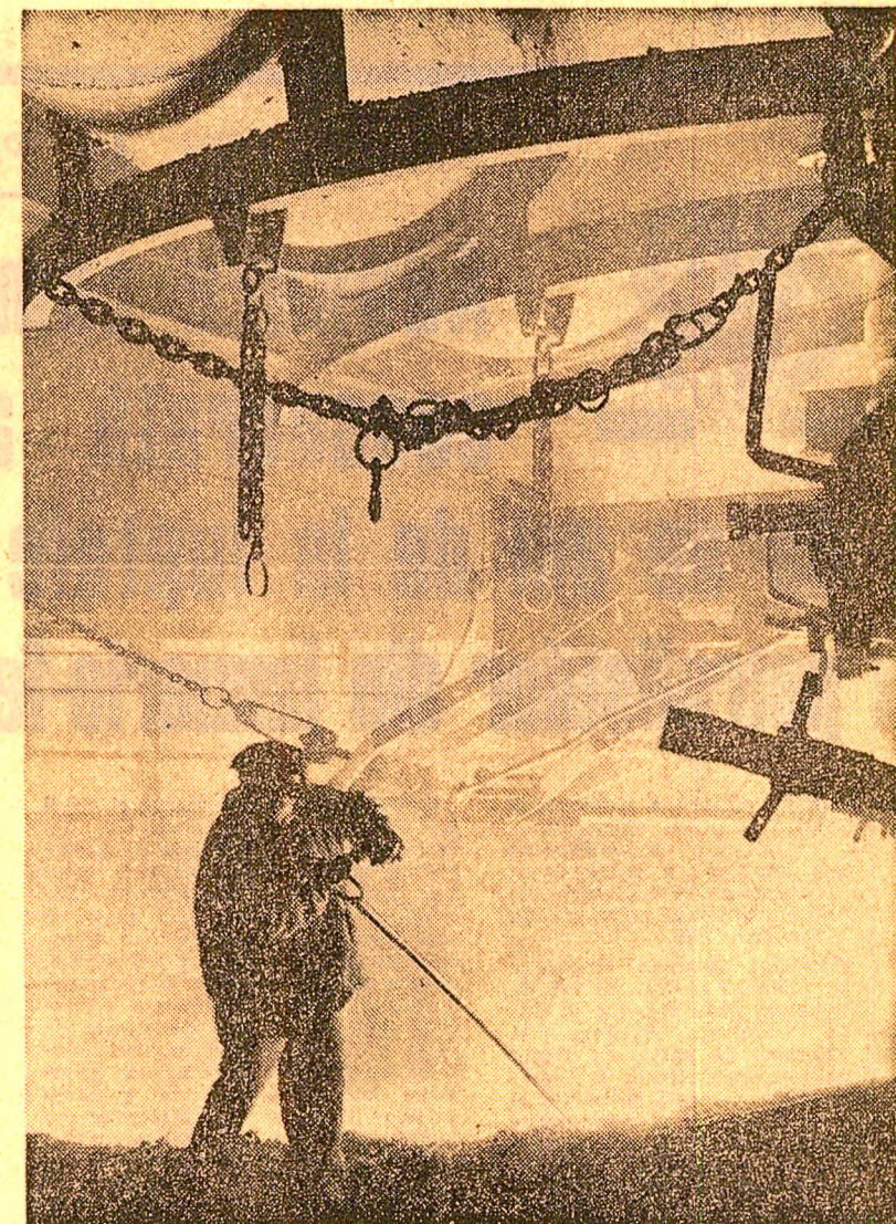
Se elaborează o nouă țară la Combinatul siderurgic din Galați

Întîmpinat cu calde manifestări de dragoste de întregul colectiv muncitoresc