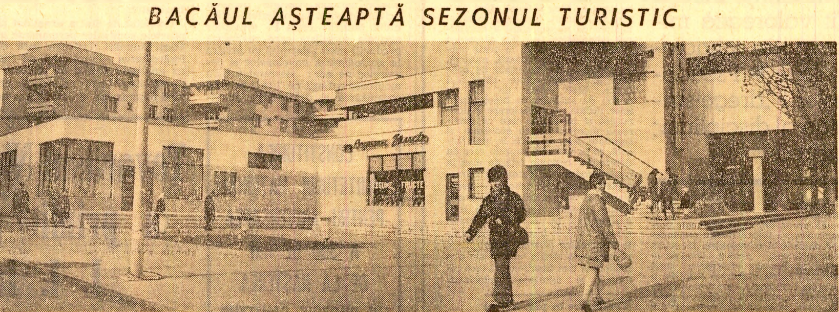
BACĂUL AȘTEAPTĂ SEZONUL TURISTIC

de cooperativă nu a realizat vreun asemenea studiu. Or, aceste analize, bazate pe sondarea punctului de vedere al populației, nu sînt niste capricii, niste cerințe abstracte, drept pentru care aducem, în continuare, câteva argumente foarte concrete. Zona cunoscută la Iași sub numele de Socola, cu aproape 35.000 locuitori, este, în prezent, insuficient dotată cu unități de servicii. Cum a stabilit cooperativa rezolvarea problemei? În planul de construcții din zona respectivă a prevăzut, pentru prima etapă (realizată, aici nu există nici mică unitate de reparat televizore sau mașini electrotcasnice), realizarea unui... „mare magazin de artizanat” (aproape o treime din suprafața complexului)