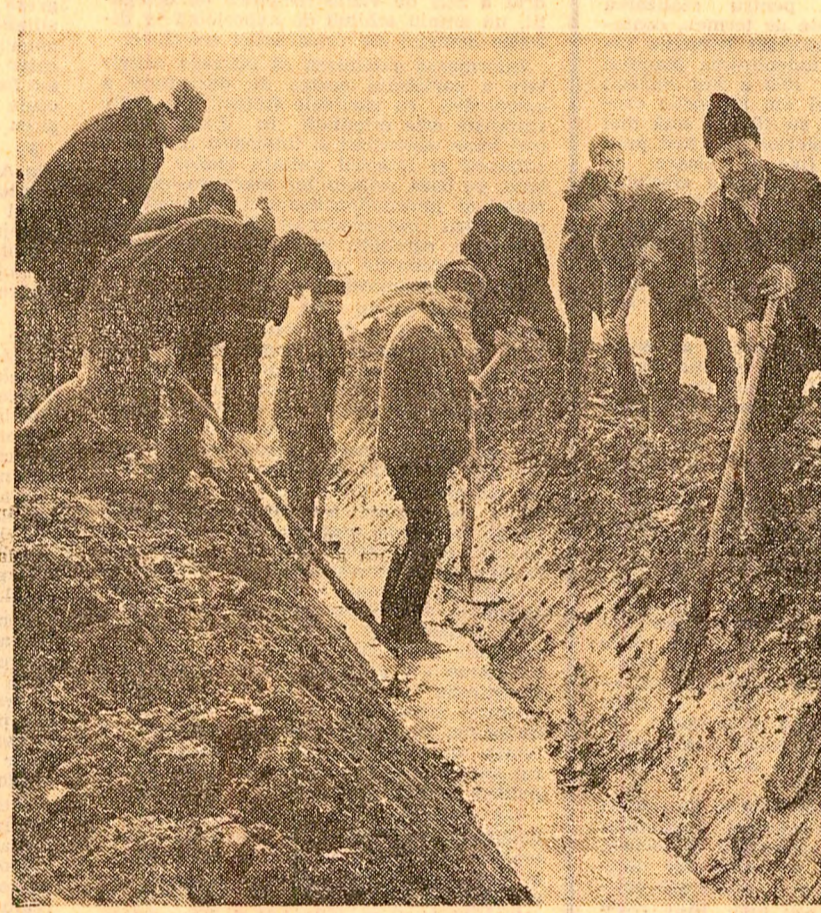
Lucrătorii de la I.A.S. Buciumeni județul Ilfov finalizează canalul colector central pentru evacuarea excesului de umiditate de pe terenurile unde urmează să se însămînțeze legume

— Cum se prezintă semănăturile de toamnă și ce lucrări trebuie făcute, în continuare, la aceste culturi? — Starea de vegetație a semănăturilor de toamnă este normală. În fiecare unitate agricolă s-a urmat periodic evoluția plantelor. Cu toate eroulile din toamna trecută, datorită faptului că iarna n-a ridicat probleme deosebite — în