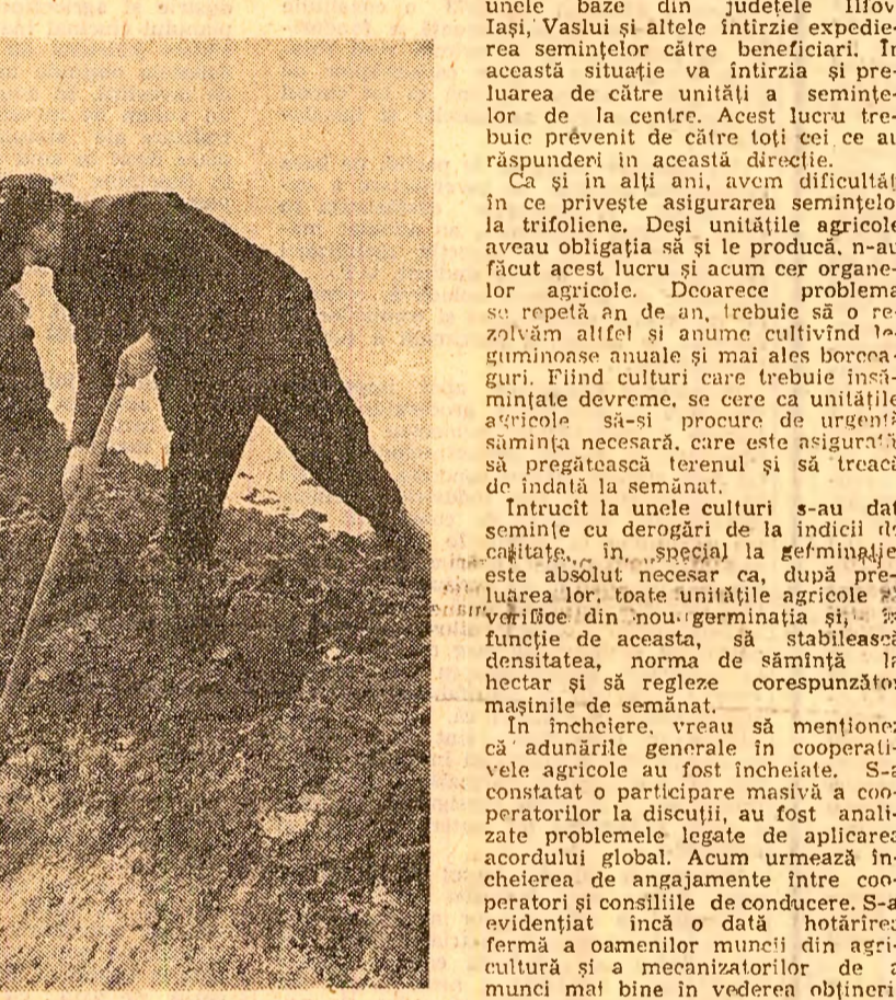
Lucrătorii de la I.A.S. Buciumeni județul Ilfov finalizează canalul colector central pentru evacuarea excesului de umiditate de pe terenurile unde urmează să se însămînțeze legume

Vreau să mai refer și la o altă problemă foarte importantă și anume la fertilizarea terenurilor. După estimările noastre, în fiecare an, în unitățile agricole se adună 7 milioane tone îngrășăminte naturale. Pînă acum în cooperative agricole au fost transportate în cîmp 5 milioane tone. Că se putea realiza mai mult o dovedește faptul că numai în ultima săptămîna au fost transportate la cîmp peste 350.000 tone. Trebuie