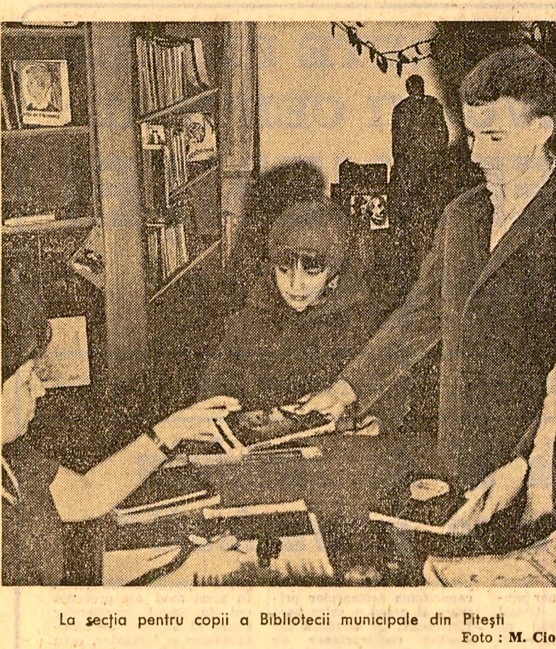
La secția pentru copii a Bibliotecii municipale din Pitești

Din păcate, nici școala nu s-a străduit prea mult să suplimenteze această lacună din activitatea organizației U.T.C., să deschidă elevilor săi, și după orele de clasă, calea spre tehnică și creativitate.