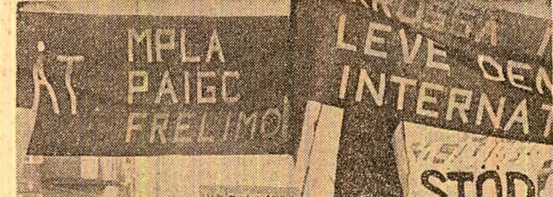
Manifestație de solidaritate, la Stockholm, capitala Suediei, cu lupta de eliberare din Angola, Mozambic, Guinea-Bissau...