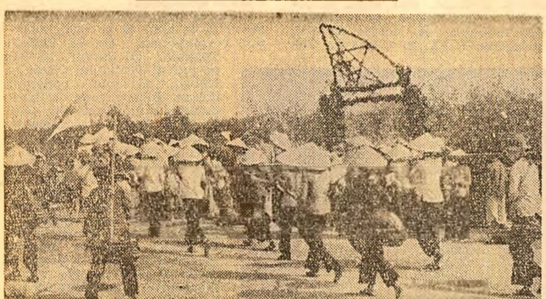
Intr-o zonă aflată sub controlul forțelor patriotice din provincia Quang Tri (Vietnam de sud): Locuitorii participând la ample acțiuni de rețevare.

HANOI 25 (Agerpres). — In ciuda condițiilor deosebit de grele din timpul războiului, R. D. Vietnam s-a dezvoltat, în ultimii ani, rețeaua de căi feroviare, rutiere și fluviale. Rețeaua, în repede rînduri, după bombardamente și constituind în prezent o obiectiv deosebit de important al reconstrucției la scară națională, căile ferate, șoselele și instalațiile portuare ale acestor țări joacă un rol major în dezvoltarea sa economică de ansamblu.