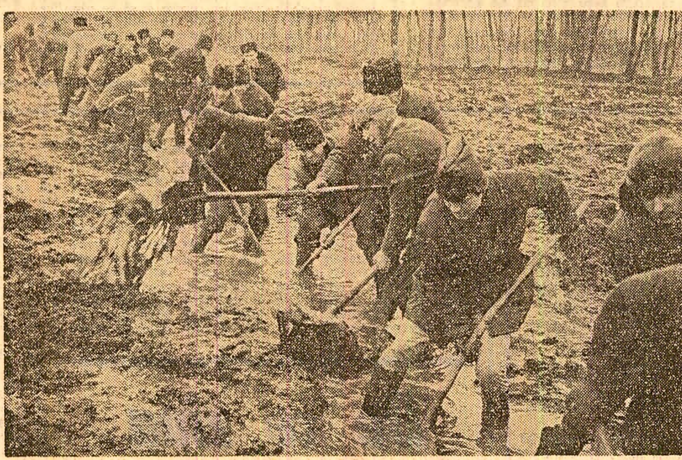
Cețanții din comuna Brădeanu, județul Buzău, au trecut urgent la săparea șanțurilor pentru ca apa să se retragă din incinta comunei și de pe terenurile agricole supuse inundațiilor.

ÎN ZIARUL DE AZI: ● ACTUALITATEA CULTURALĂ ● In confruntare: SCRISORI ȘI RĂSPUNSURI ● PE SCURT, DIN ȚARĂ ● 80 DE ANI DE LA NAȘTEREA LUI PALMIRO TOGLIATTI