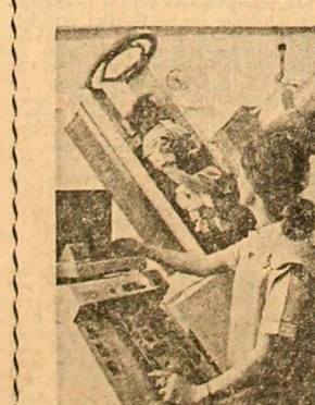
Recent s-a inaugurat la Londra un nou spital a căruia secție de radiologie este complet automatizată. Radiologii vor putea manevra