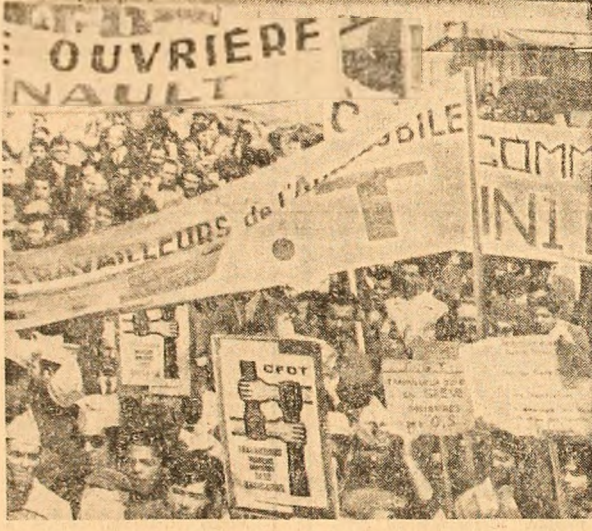
Franta. Demonstrație a muncitorilor de la uzinele Renault din Boulogne-Billancourt pentru îmbunătățirea sistemului de salarizare și a condițiilor de muncă

LONDRA 1 (Agerpres). — Începând de la 1 aprilie, ora 24.00, în Marea Britanie va intra în vigoare legea privind introducerea unei taxe asupra valorii adăugate (T.V.A.), care, după părerea specialiștilor, reprezintă cea mai importantă măsură fiscală britanică în ultimul secol. „Impozitul european” prin excelență, apreciază agenția France Presse, taxa asupra valorii adăugate îi va apropia și mai mult pe britanici de partenerii lor din Piața comună în ce privește sistemul fiscal. În așteptarea introducerii acestei măsuri, magazinele au fost asaltate în ultimele zile, de cumpărătorii care și-au făcut adevărate stocuri din produsele care vor fi scumpe, prin introducerea T.V.A. Cel aproximativ 1.200.000 de salariați din comerț au lucrat febril, duminică, pentru schimbarea etichetelor aplicate pe mărfurile ale căror prețuri sînt afectate de introducerea noului sistem fiscal. Se apreciază că taxa asupra valorii adăugate va provoca o scumpire medie de 1 la sută a costului vieții.